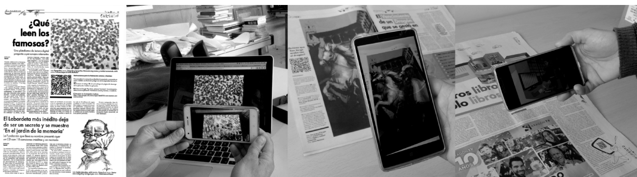
Imagen 3: Algunos ejemplos de acceso en interactividad del periódico con contenidos digitales. (Dcha.) Página de Diario de las Bellas Artes con interactividad mediante código QR impreso y mediante imagen-código. (Izda.)

Se crean dos tipos de acceso a la información digital. Mediante código QR con enlace directo a la animación en youtube y mediante Imagen-código con enlace a PlayStore donde se descarga el contenido audiovisual mediante una app.