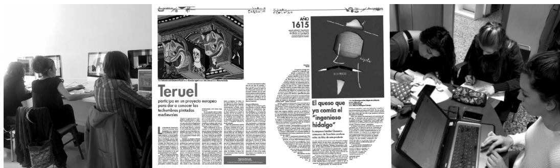
Imagen 2: Alumnos de 3.º y 4.º curso del Grado en Bellas Artes trabajando en la edición del Diario de las Bellas Artes . Las fotografías están tomadas durante la sesión de trabajo del 25/04/2016 en el Aula de Diseño Gráfico del Edificio de Bellas Artes (izda.) y en la sede de Diario de Teruel (dcha.). En el centro se muestran algunas páginas de Diario de las Bellas Artes .