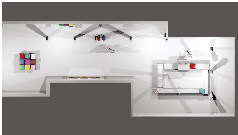
Ilustración 3. Plano de planta de la instalación y ubicación espacial de cada pieza.

Gracias a los resultados obtenidos en la fase uno de la metodología, se generó una propuesta instalativa conformada por tres piezas: