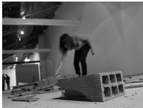
Habitar la derrota , María Vallina, 2012.

El leve sonido del recorrido se instalaba en lo más predecible de la repetición para romperse con el estruendo del derrumbe de un muro cuyos chasquidos saltan desparramados para irrumpir en el deseo de acabar con la monotonía pero dando lugar a la peligrosidad de los escombros.