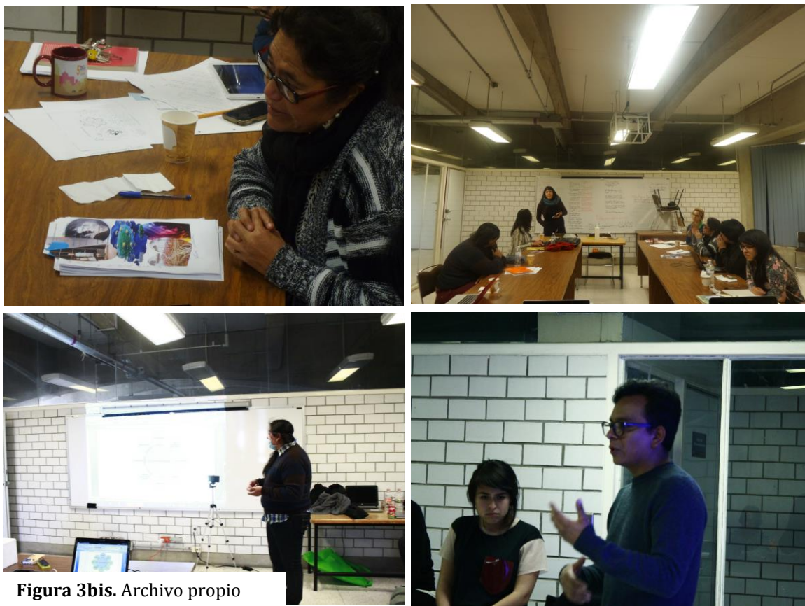
Figura 3bis.

La última parte de este ejercicio consiste en redactar metodológicamente su propuesta, el proceso de cómo transcurrió el desarrollo y transformación de los conceptos; así como brindar su testimonio de si la práctica artística les permitió o no reconocer las relaciones culturales en el lenguaje y su posible modificación. En esta etapa fue importante enfatizar el darse cuenta de las formas personales con que organizamos nuestra producción, de los modos en que solemos acudir a nuestra experiencia, percepción u emoción para configurar un proyecto. La apropiación de estas reflexiones es lo que, consideramos, constituye la información de lo real, lo real como fenómeno para la investigación y producción a partir de la experiencia de las personas con el mundo.