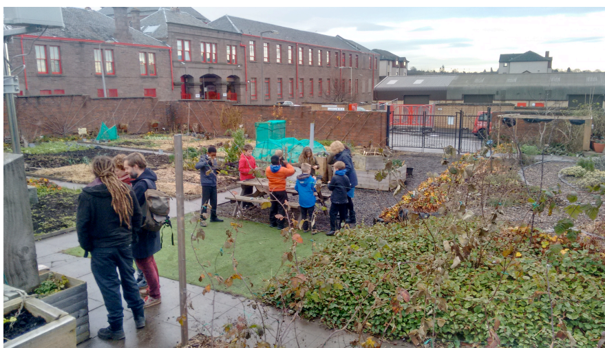
Ilustración 7. Centro comunitario MAXwell: huerto detrás de la iglesia con niños participando.