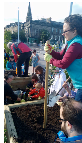
Ilustraciones 5 y 6. Huerto de frutales y aromáticas, Slessor Gardens en la nueva ampliación del puerto de Dundee.