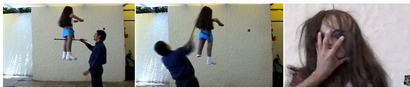
Figura 3. Frames extraídos del video “La Piñata” de Teresa Serrano. Vimeo .

»No pierdas el tino porque si lo pierdes, pierdes el camino «el juego perverso » violencia de género «