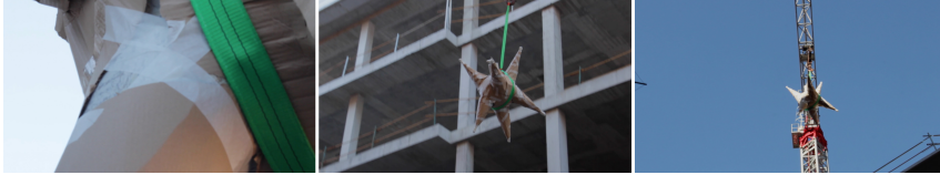
Figura 4. Frames extraídos del video “Línea de sustitución” de Edurne González Ibáñez.

El video “Línea de sustitución” se llevó a cabo en 2016 y forma parte de un proyecto más amplio titulado “Doble Derrumbe” que ha sido expuesto en la Fundación Bilbaoarte Fundazioa dentro de sus Puertas Abiertas 2016 y también en la exposición colectiva Palimpsesto que tuvo lugar en Bastero Aretoa de Andoain dentro del Programa Harriak que anualmente organiza Eremuak. En el video se cuestionan las lógicas y las decisiones por las que permanecen o se aniquilan ciertas memorias a través de las políticas de transformación de las urbes. Estos hechos que en muchas ocasiones se presentan como mejoras necesarias o actuaciones vinculadas a procesos mayores, van dando forma a la identidad de la ciudad, teniendo una influencia directa sobre la construcción de los relatos que se fortalecen y los que se silencian.