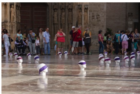
00 cabezas, 100 mujeres, 100 vendas moradas.

Entre otras intervenciones también destacamos el trabajo realizado junto al escultor Juan Flores a partir de la acción que reproducía diferentes cabezas realizadas a través de molde de escayola con la colaboración de diferentes colectivos como Ciutat Vella Batega, Salvem el Cabanyal y Horta és Futur en una intervención de 100 cabezas en la plaza del Ayuntamiento de Valencia. En 2015 se une al proyecto de Mujeres y punto "No quiero ser huevo frito" el cual remite a la teoría del aislamiento de la mujer sometida al hombre. A partir de ahí realizan una campaña poniendo en relieve la poca presencia femenina en las elecciones durante las elecciones de junio de 2016. Varias cabezas de mujeres pasan a formar parte de esta intervención con una mordaza en punto color morado realizadas por Mujeres y punto que tapaba la boca de cada cabeza.