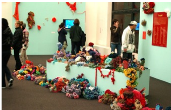
El arrecife de Chicago muestra en el Centro Cultural de Chicago (otoño de 2007). El arrecife de Chicago fue encabezado por el Jane Addams Hull-House Museum, en conjunción con el Festival de Humanidades de Chicago.