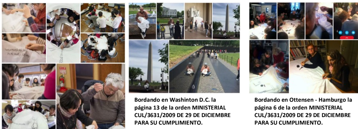
Bordando en Mukojima la página 5 de la orden MINISTERIAL CUL/3631/2009 DE 29 DE DICIEMBRE PARA SU CUMPLIMIENTO.