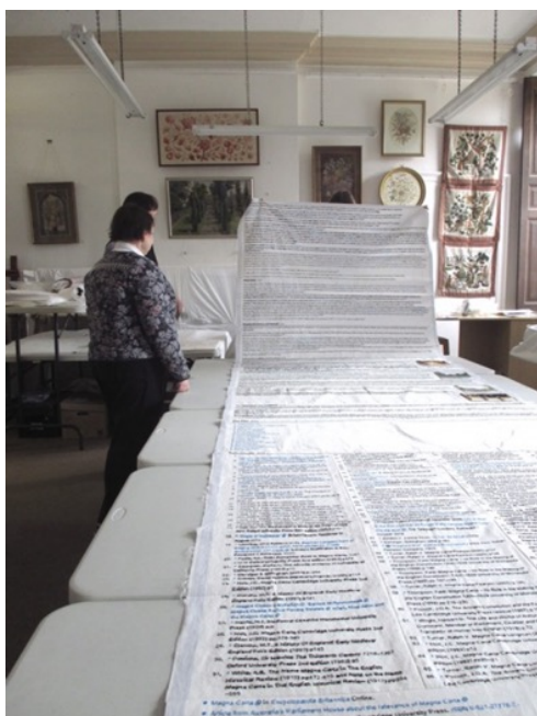
Cornelia Parker - Carta Magna In: http://www.royalneedlework.org.uk/galleries/images/35/

En 2015 la artista Cornelia Parker ha realizado la obra Magna Carta (un bordado de la representación completa del texto y imágenes de la Carta Magna como aparece en la página de la enciclopedia online Wikipedia en 2014). Un bordado en gran formato en una tela de 1,5 metros de ancho y casi 40 metros de largo, dividida en 87 partes las cuales fueron enviadas a 200 personas para colaborar en el bordado de la obra, entre ellas presos, defensores de los derechos civiles, parlamentarios, abogados, barones y artistas. La mayor parte del trabajo fue realizado por 36 presos de 13 cárceles diferentes en Inglaterra. También ha participado del proyecto personalidades como Edward Snowden bordó la palabra 'libertad' y Jimmy Wales el creador de Wikipedia que bordó la palabra Wikipedia, entre otros. Esta obra hace parte del homenaje a los 800 aniversario de la Carta Magna, la cual estuvo en exposición en el vestíbulo de la biblioteca británica.