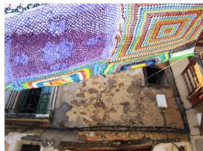
Tejiendo Calle - https://submarina.info/tejiendo-la-calle/

En contra punto, pero con similitudes al proyecto Tejiendo Calle , se encuentra el proyecto Crochet Coral , iniciado en 2015 en Los Ángeles por Margaret Wertheim y Christine Wertheim para el The Institute For Figuring, que consiste en realizar a través del ganchillo, mezclando hilo con la basura de plástico, arrecifes en lana, generando ambientes marinos recreados a partir de la intersección del arte de tejer, con las matemáticas, con la ciencia, como signo de protesta contra el calentamiento global. Inspirados en la técnica de "Crochet hiperbólico", "flecós", anémonas almenadas "babosas de mar", y "corales" modelados con estos métodos, que van creciendo y formando sub-arrecifes a través de colaboraciones de comunidades que están por todo el mundo desde Chicago, Nueva York y Londres, Melbourne, Dublín y Ciudad del Cabo. El proyecto sigue abierto a colaboraciones para realización colectiva de arrecifes para el instituto, a través de su página web ( http://crochetcoralreef.org ) se puede registrar y encontrar todas informaciones como derecho de autor, tamaño, duración del proyecto, proporcionando un apoyo a diferentes etapas del proceso. El proyecto viene siendo presentado a través de exposiciones, charlas, en diferentes partes del mundo. Es un proyecto colaborativo que crece con la colaboración proliferándose como los arrecifes vivos que envían semillas de regeneración.