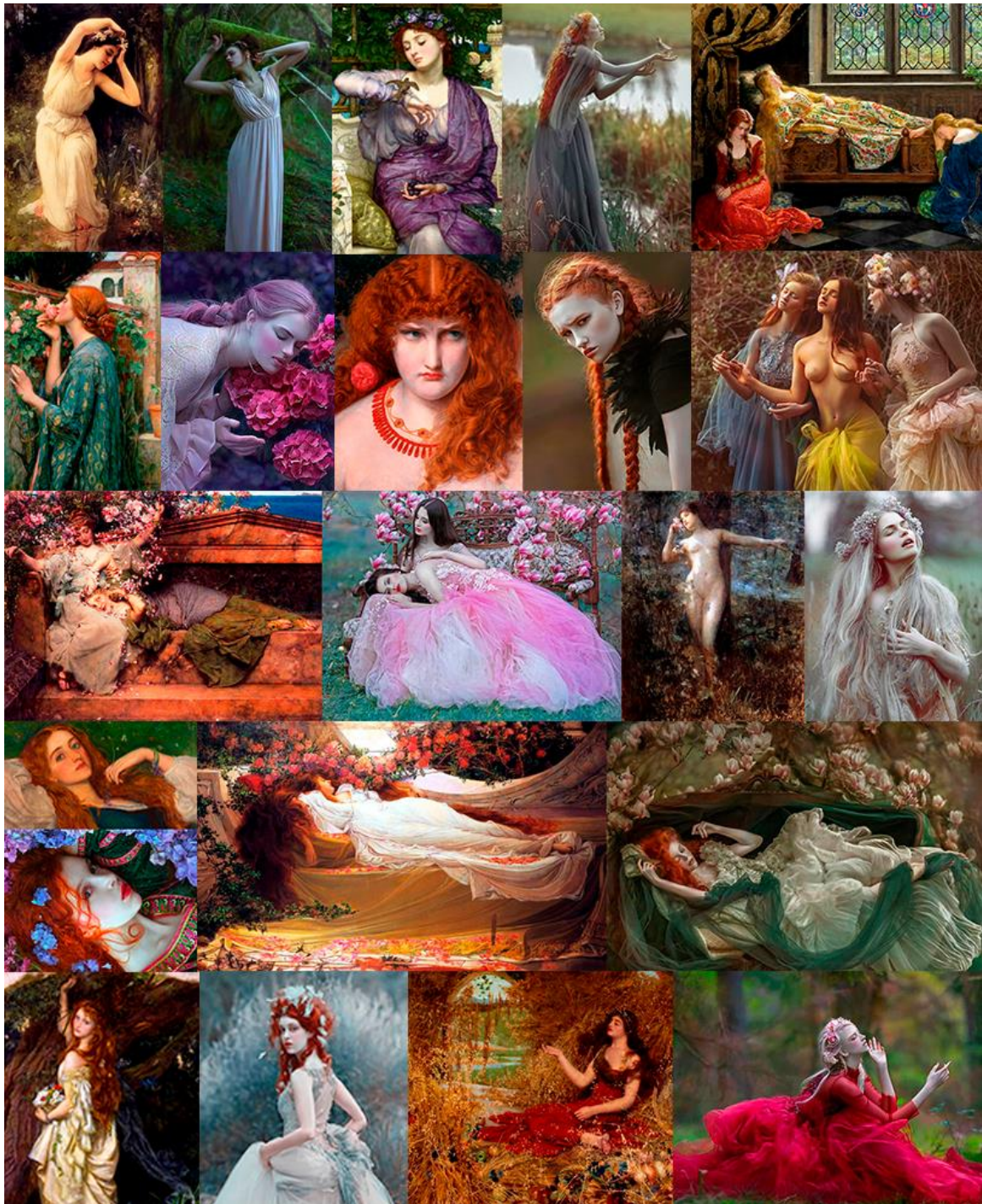
Figura 38: Collage de cuadros prerrafaelitas y fotografías de @agnieszka_lorek

OBRAS DE IZQUIERDA A DERECHA: Lenoir, C.A. (1899) Una ninfa en el bosque Poynter, E. J. (1907) Lesbia y su gorrión Collier, J. M. (1921) La bella durmiente Waterhouse, J. W. (1908) El alma de la rosa Sandys, F. (1867) Helena de Troya