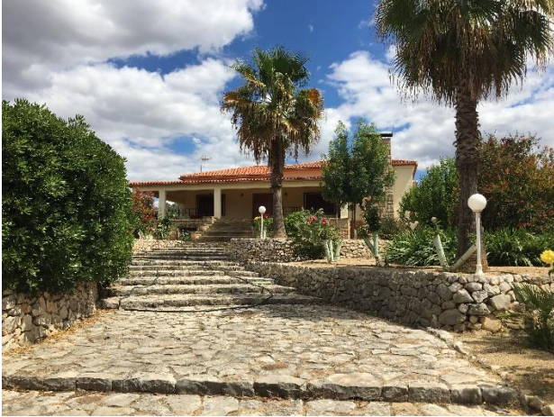
IMAGEN 1 ENTRADA DE LA CASA