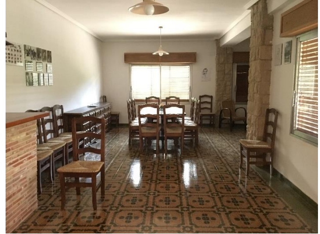
IMAGEN 2 SALÓN DEL INTERIOR DE LA CASA