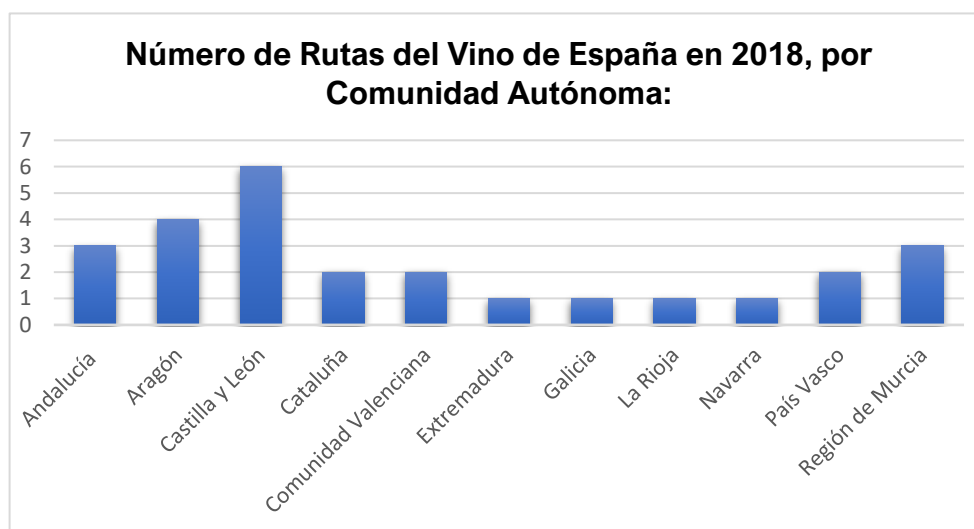
GRÁFICO 3 GRÁFICO DE REPRESENTACIÓN DE LAS RUTAS DEL VINO DE ESPAÑA POR COMUNIDAD AUTÓNOMA, ELABORACIÓN PROPIA A TRAVÉS DE LOS DATOS OFRECIDOS POR STATISTA

De las 26 rutas las que están certificadas por ACEVIN son las siguientes: