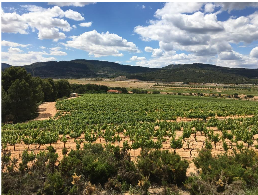
IMAGEN 3 HECTÁREAS DE VIÑEDO DE LA FINCA

La extensión de viñedo de la finca suma un total de 42 hectáreas dedicadas al cultivo de uva tinta Cabernet Sauvignon, Monastrel y uva blanca Chardonnay. La variedad de uva Cabernet Sauvignon es la que genera una mayor producción con un total de 27.000 litros por cosecha, mientras que la modalidad Monastrel alcanza los 11.000 litros por cosecha. La variedad Chardonnay ha sido la última incorporación al total de hectáreas, el 2018 será el primer año en el que se recoja la cosecha, por lo que no se puede constatar una cantidad exacta de los litros que producirá.