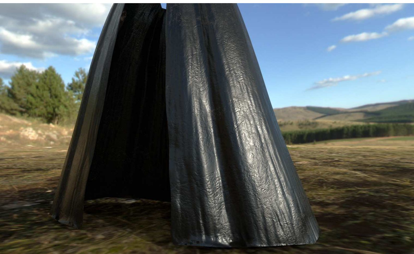
Pruebas de materiales (cuero)