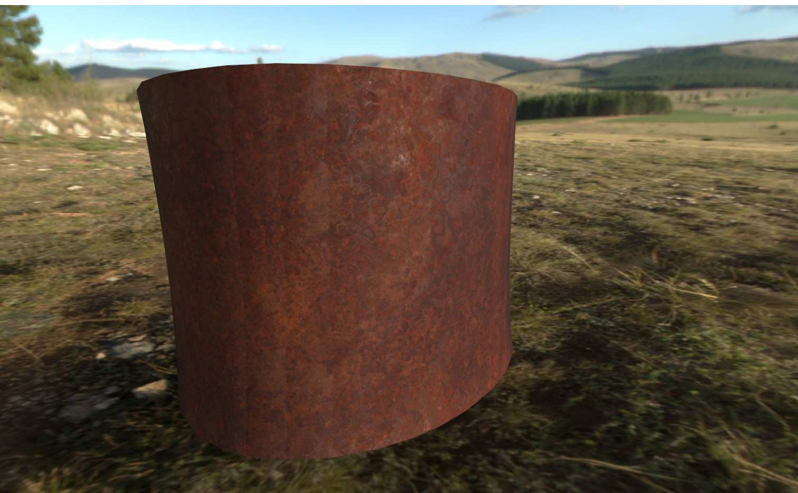
Pruebas de material