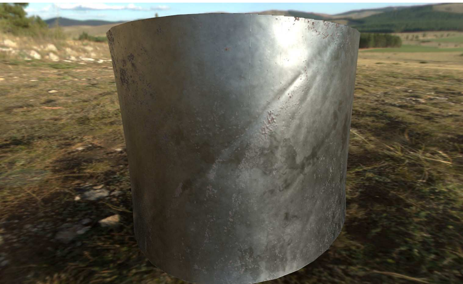
Segunda prueba de material