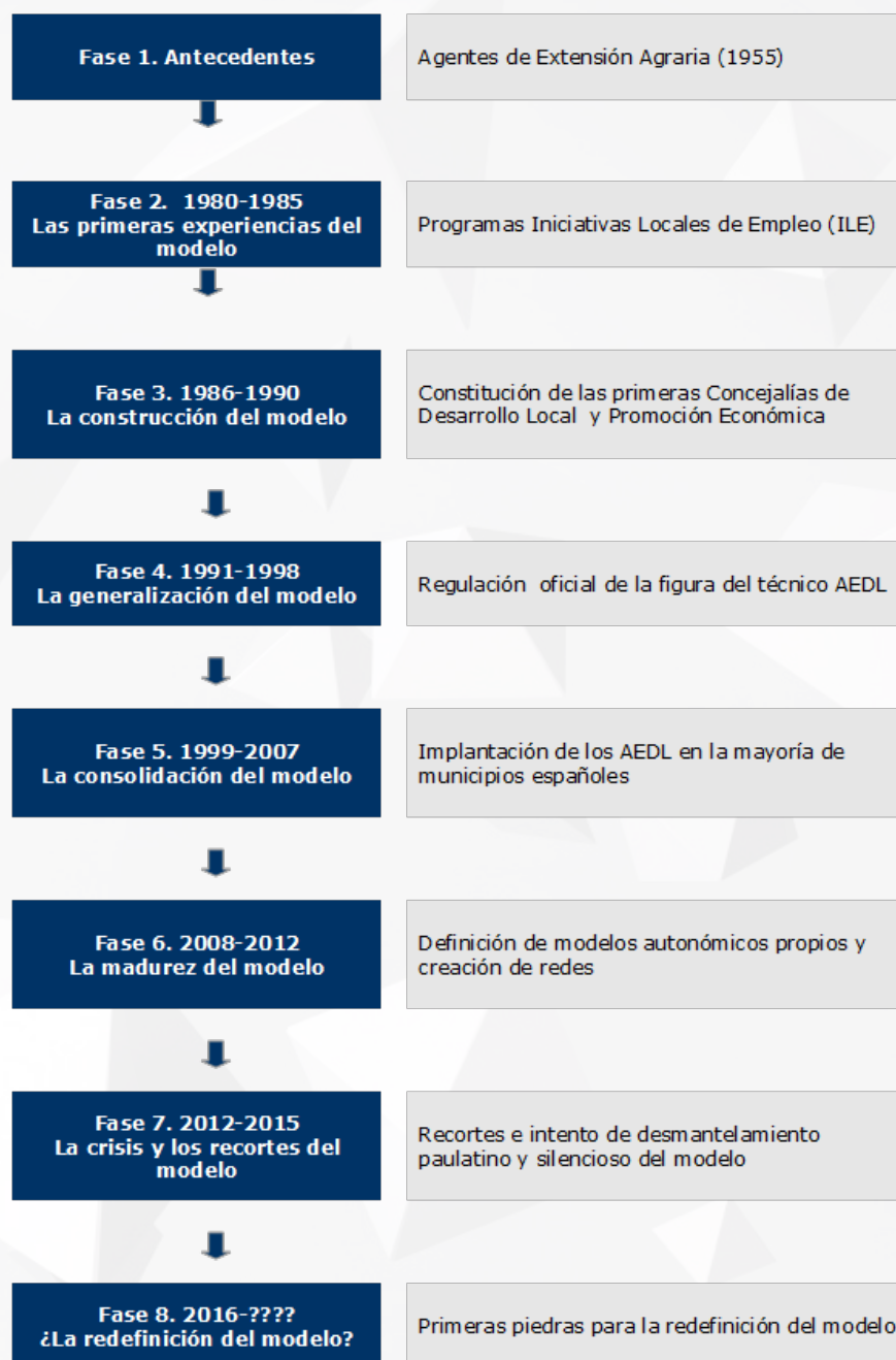
Figura 1. Proceso evolución del modelo de desarrollo local en España