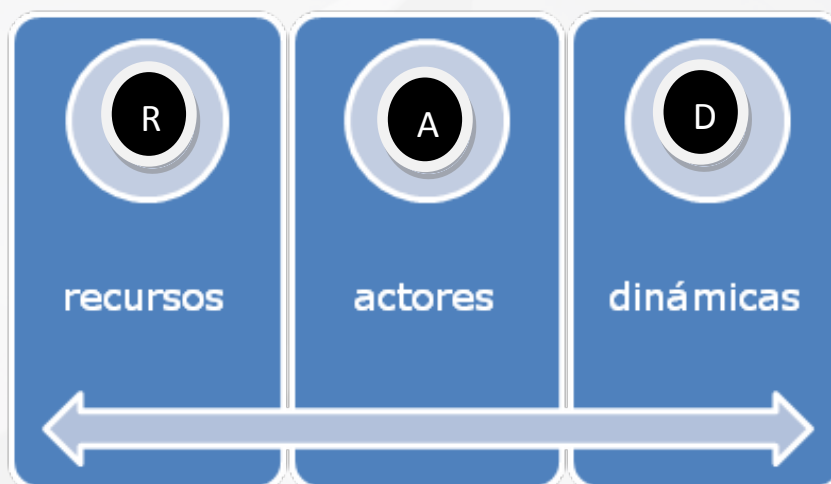
Figura 3. Los elementos esenciales para el desarrollo