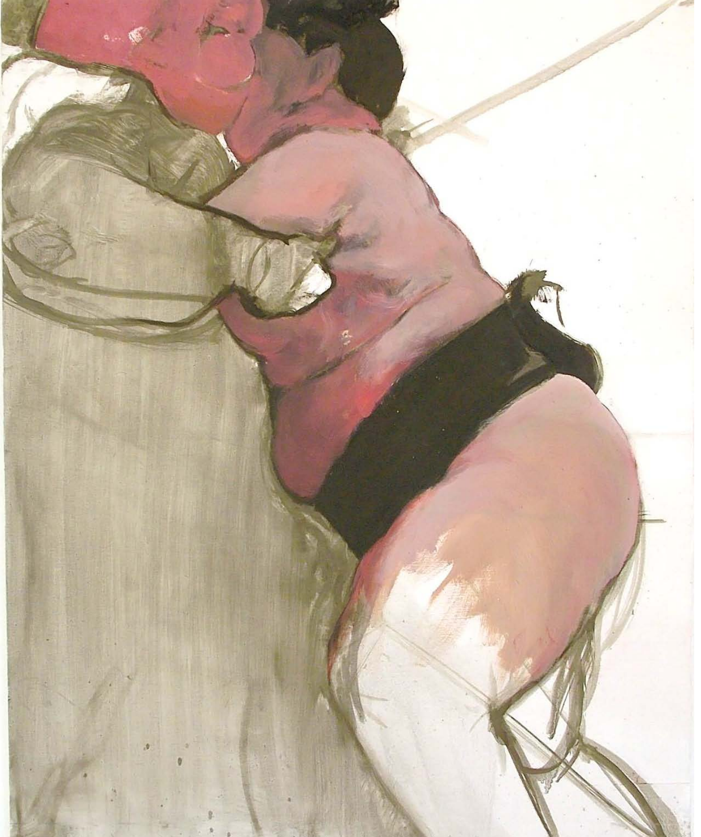
Victoria Cabedo: Fight for a space I , 2018 Serie Proxemia Óleo sobre chapa, 100x70 cm