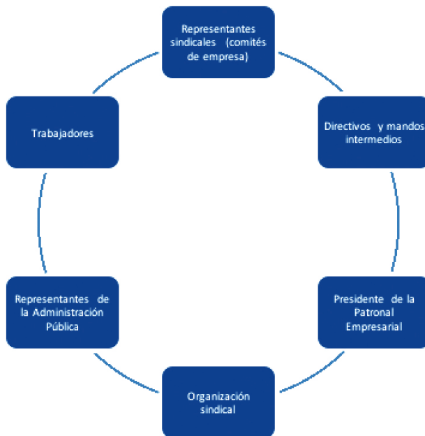
Figura 1 Actores del proceso de auditoría