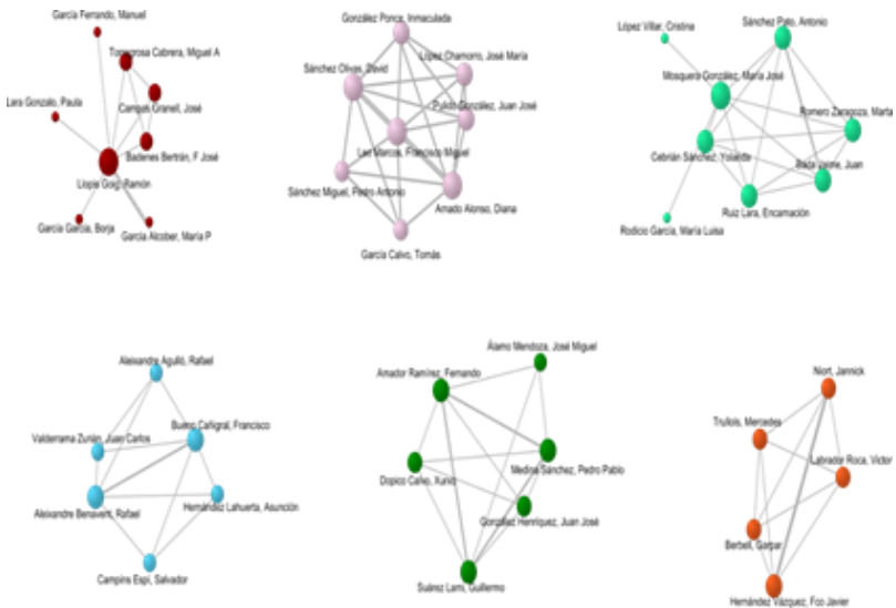
Figura 3. Red de autores, grupos de 6 a 8 componentes