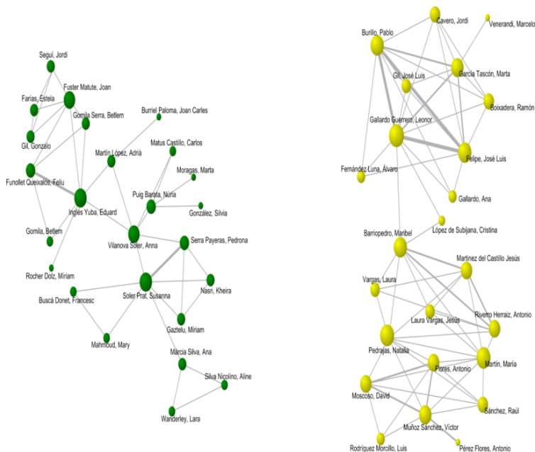
Figura 1. Red de autores (grupos de 25 y 24 integrantes)

(n=4), el 1% de Reino Unido (n=3) y el 0,7% de Italia y Estados Unidos, respectivamente (n=2).