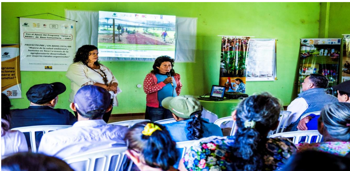
Imagen 1. Intercambio de saberes en Tavaí.

El 24 de octubre de 2017 se llevó a cabo una jornada de intercambio de saberes entre líderes/as y miembros de organizaciones comunitarias de base que son apoyadas por el PPD Paraguay, y el Proyecto CBR+. El evento fue organizado por el Programa conjuntamente con una de las organizaciones beneficiarias y la organización implementadora del Proyecto. La jornada tuvo como objetivo “Intercambiar saberes, prácticas y experiencias entre organizaciones campesinas, comunidades indígenas y organizaciones de la Sociedad Civil que accionan localmente para alcanzar impactos globales ambientales”.