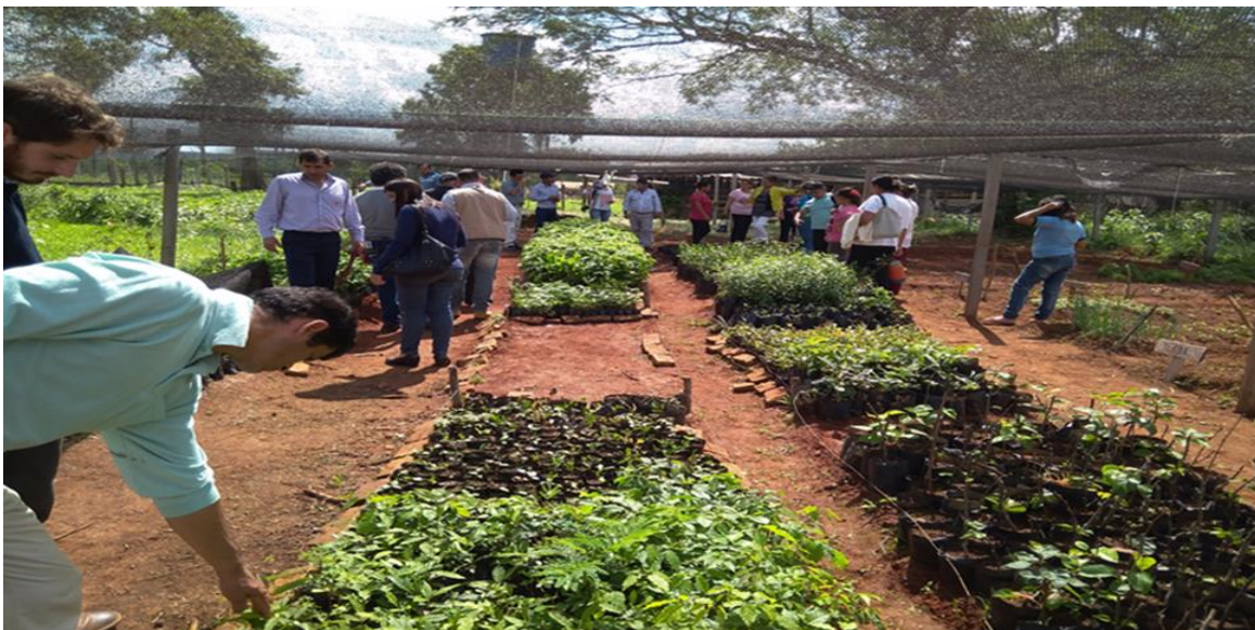
Imagen 3. Visita al proyecto “Mejora de la salud ambiental y humana en Tavaí a través de la Agroforestería”.

El segundo viaje se realizó con el objetivo de asistir a la jornada de intercambio de saberes y experiencias entre líderes y miembros de organizaciones comunitarias de base que son apoyadas por el PPD Paraguay, como se ha desarrollado en el apartado anterior.