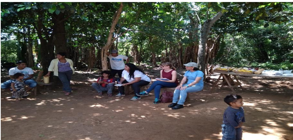
Imagen. 4. Reunión comunitaria en una de las comunidades indígenas.

Los tres viajes a campo realizados, permitieron poner en práctica la técnica de la observación participante, ya que los miembros de las comunidades no eran conocedoras de mi investigación y por lo tanto actuaron con total naturalidad en las diversas situaciones. A través de dicha técnica, se pretendió llevar a cabo una observación del comportamiento tanto de mujeres como de hombres dentro de sus respectivas comunidades, así como su forma de dirigirse y relacionarse con los y las trabajadoras del PPD y de las ONG. Permitted de esta manera analizar si las mujeres hablan y expresaban sus opiniones en público, participando activamente de las reuniones comunitarias o si por el contrario permanecían en silencio durante dichas reuniones y reservaban su opinión para el ámbito privado. Así mismo, se pretendió, a través de la observación participante, dar respuesta a algunas preguntas como las siguientes: ¿Mujeres y hombres participan de igual manera en los procesos de toma de decisión comunitaria? ¿Cómo es la relación entre los miembros de las comunidades y las trabajadoras del PPD y de las ONG acompañantes? ¿Se fomenta la agencia de las mujeres por parte de las trabajadoras del PPD y las ONG?