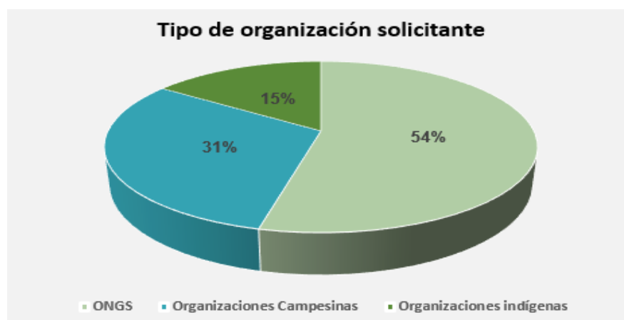
Figura 4. Tipo de organización solicitante.

Durante el periodo de análisis del presente estudio, el PPD implementó trece proyectos en el marco del Programa CBR+, de los cuales hemos analizado solamente cuatro. Sin embargo, para obtener una visión lo más amplia posible, cabe mencionar que, de los trece proyectos implementados, siete corresponden a ONGs (54%), cuatro a organizaciones campesinas (31%) y solamente dos a organizaciones indígenas (15%), como podemos observar en el siguiente gráfico (PPD, 2017).