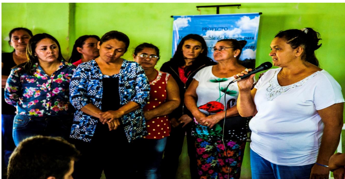
Imagen 2. Intercambio de experiencias en Tavaí.

El 31% restante (33 personas) fueron técnicos de ONGs, instituciones públicas e independientes que trabajan con las organizaciones apoyadas por PPD, PNUD y el equipo técnico del PPD.