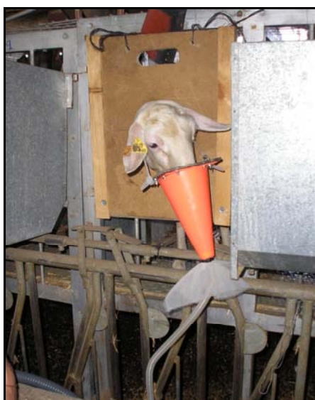
Figura 4. Colocación de la máscara en uno de los animales de la prueba.

Tras colocar la máscara en la cabeza del animal se siguió la metodología propuesta por Brosh et al. (2002). Este aire quedaba contenido en una bolsa-balón Douglas (PanLab S.L. Harvard Apparatus) con una capacidad de 15 litros que se cerraba herméticamente y se llevaba al laboratorio, donde se conectaba a un analizador de gases (Easyflow 3020, ABB S.A.) con cubetas de calibración incorporadas para medir concentraciones de oxígeno,