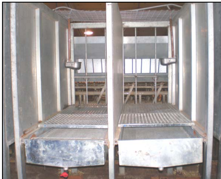
Figura 1. Jaulas metabólicas individuales con el comedero en el exterior, bebedero automático y bandejas de separación de heces y orina.

Durante todo el periodo experimental se controló el consumo y la producción de heces y orina. La ración se ofrecía a los animales en dos tomas diarias (8:00 y 15:00 horas). Y fue durante la fase experimental de 5 días (tiempo que duraron las pruebas de digestibilidad) cuando se registró el consumo de alimento (por diferencia entre el alimento ofrecido y la recogida y peso diario del rehusado [ING]) y la producción de heces [EXCR] (Figura 2). La orina se recogió durante la prueba de digestibilidad y fue utilizada para calcular la energía metabolizable (EM). Mediante la cuantificación y