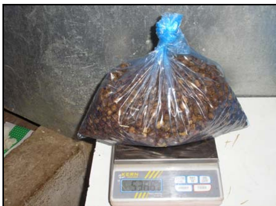
Figura 2. Recogida y medición de heces diarias en bolsas individuales.

Las heces de cada día eran congeladas a -20\text{ }^{\circ}\text{C} hasta el momento de su análisis, en el que se analizó el homogeneizado de cada animal de toda la fase experimental. El recipiente en el que se recogía la orina contenía 2 cc de una solución de ácido sulfúrico al 10 %, de modo que la orina entraba en contacto con el ácido sulfúrico inmediatamente, con objeto de evitar pérdidas de nitrógeno amoniacal. Se tomaba una muestra representativa de la orina excretada diariamente por las ovejas, que también se congeló hasta el momento de su análisis a -20^{\circ}\text{C} .