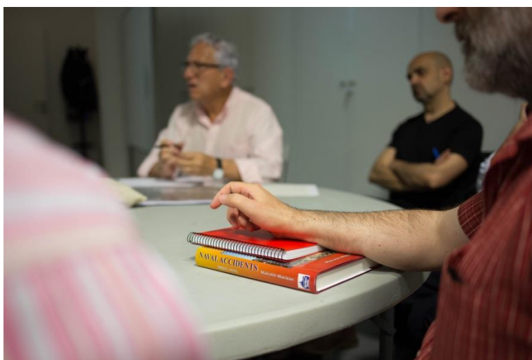
La localización de información en fuentes escritas es clave en la documentación fotográfica.

En abril de 2013 se realizó la primera sesión de identificación de fotografías navales, invitando al Grupo y otros expertos en la materia. La buena acogida y la petición por parte de los asistentes en preparar nuevas convocatorias, nos hizo establecer una programación anual de 4 sesiones. Y aún más: entre los asistentes, un reducido grupo empezó a asistir semanalmente al museo para ayudarnos en la documentación de las fotografías. De esta manera, el proyecto evolucionó en dos grupos de trabajo que se complementaban: por un lado, el Laboratorio de expertos en fotografía naval que se reúne semanalmente en el museo para contrastar y completar la información que contiene cada uno de los registros fotográficos sobre barcos mercantes y militares y, por otro lado, la actividad Sesiones de identificación de fotografía naval.