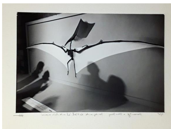
(Fig. 6) Homenaje a Man Ray, Joan Fontcuberta