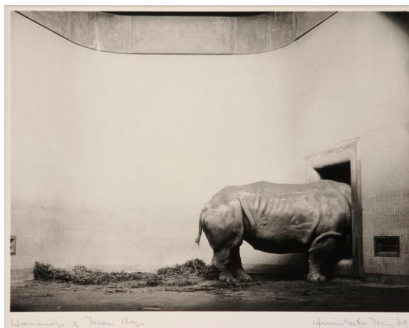
(Fig. 5) Homenaje a Man Ray, Humberto Rivas

En Barcelona se crearon grupos para intentar promocionarse, ayudarse y aprovechar la iniciativa de los demás, el más conocido fue el Grupo Alabern, este grupo reivindicaba la “fotografía de autor” como expresión artística. El artista nunca participó en ellos, pero fue muy activo en la organización de las Jornadas Catalanas.