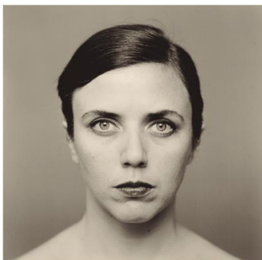
(Fig. 7) María 1978, Humberto Rivas. Archivo Humberto Rivas

Sus imágenes reflejan su más íntima esencia, son su autorretrato, el resultado de una mirada directa y sutil, con la que empapa al espectador de su personalidad (Fig. 7). Son imágenes sobrias y sencillas donde la memoria y el paso del tiempo está presente. “Aunque es fiel a la representación de la realidad lo invisible es protagonista, es el sentido visual de la imagen” (Schnaith, 2011:11). Los trazos del tiempo son perceptibles en sus retratos, fotografías de esquinas, de lugares en abandono, y de ángulos interiores. Construye la imagen a partir de bases geométricas existentes en las formas visibles y las refuerza con luces sugerentes, que contribuyen a la creación de ese clima concebido previamente y que irá perfilando su forma de expresión y su propio retrato.