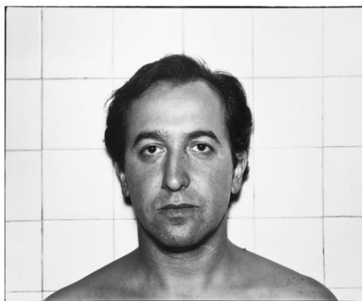
(Fig. 1) Autorretrato, 1978.

Rivas a la renovación del panorama fotográfico español, analizando las características de su obra en estos años. Para ello, se partirá de estudios de historiadores de la fotografía y publicaciones especializadas nacidas en la década, profundizando en la investigación mediante la información recogida en entrevistas, documentos, y el acceso a los fondos fotográficos del artista; aportando un enriquecimiento tanto formal como sensorial a la transmisión de la lectura de sus imágenes.