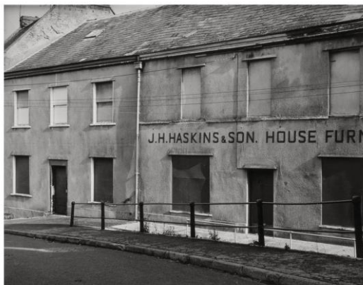
(Fig. 9) Inglaterra, 1979.

acceder; a una flor marchita donde la textura y caída de su pétalo evidencia una vida vivida y el paso del tiempo. La memoria está escrita en sus rostros, el silencio y la luz de sus calles o cementerios.