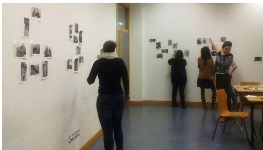
Fig. 4 Trabajando con los atlas personales sobre el tema de la familia y el silencio en el Master de Periodismo Cultural en marzo de 2017

Los alumnos pueden entonces generar un atlas propio a partir de una imagen que previamente han traído de casa sobre el tema y que será a partir de la cual podrán ir sumando otras al montaje de su atlas; para configurar un collage-montaje de esas imágenes y otras muchas, normalmente hablando sobre su propia familia y sus silencios.