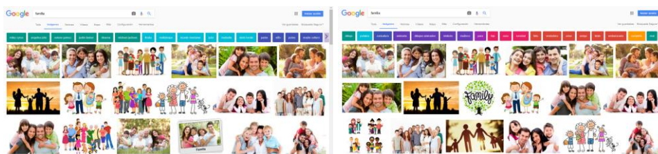
Fig. 3 18 primeros resultados de la palabra familia en el buscador de imágenes de google el 21 y el 30 de septiembre de 2017

El binomio invoca a la búsqueda de nuestras propias narrativas alternativas y a la búsqueda desde nuestra-s propia-s imagen-es. Para profundizar en el tema se revisa el trabajo de algunos artistas que han retratado su entorno familiar. Las narrativas alternativas de los artistas aportan puntos de vista distintos a los canónicos sobre el tema como podemos ver en una rápida búsqueda en google.