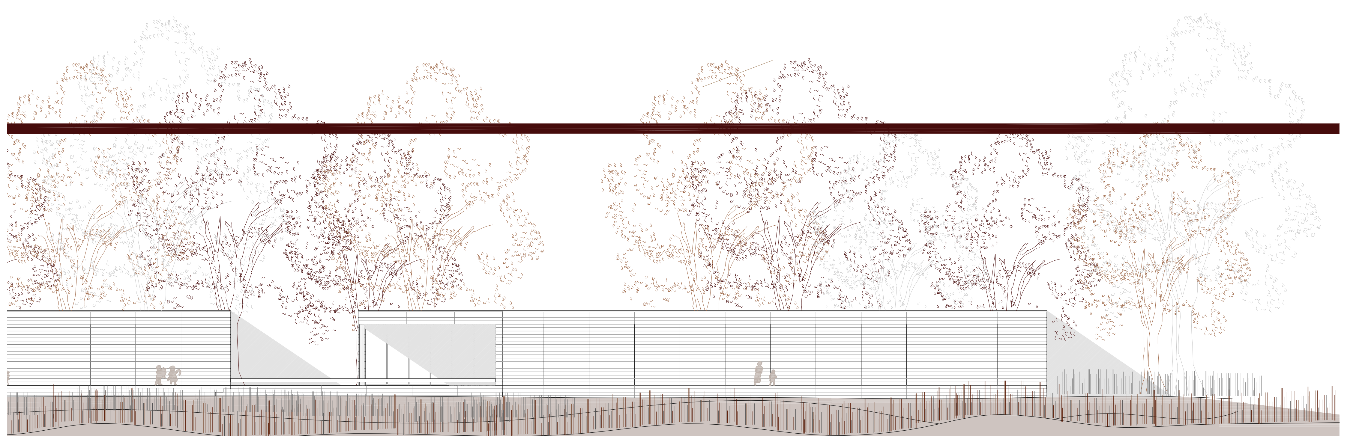
SECCIÓN A-A' E 1.100