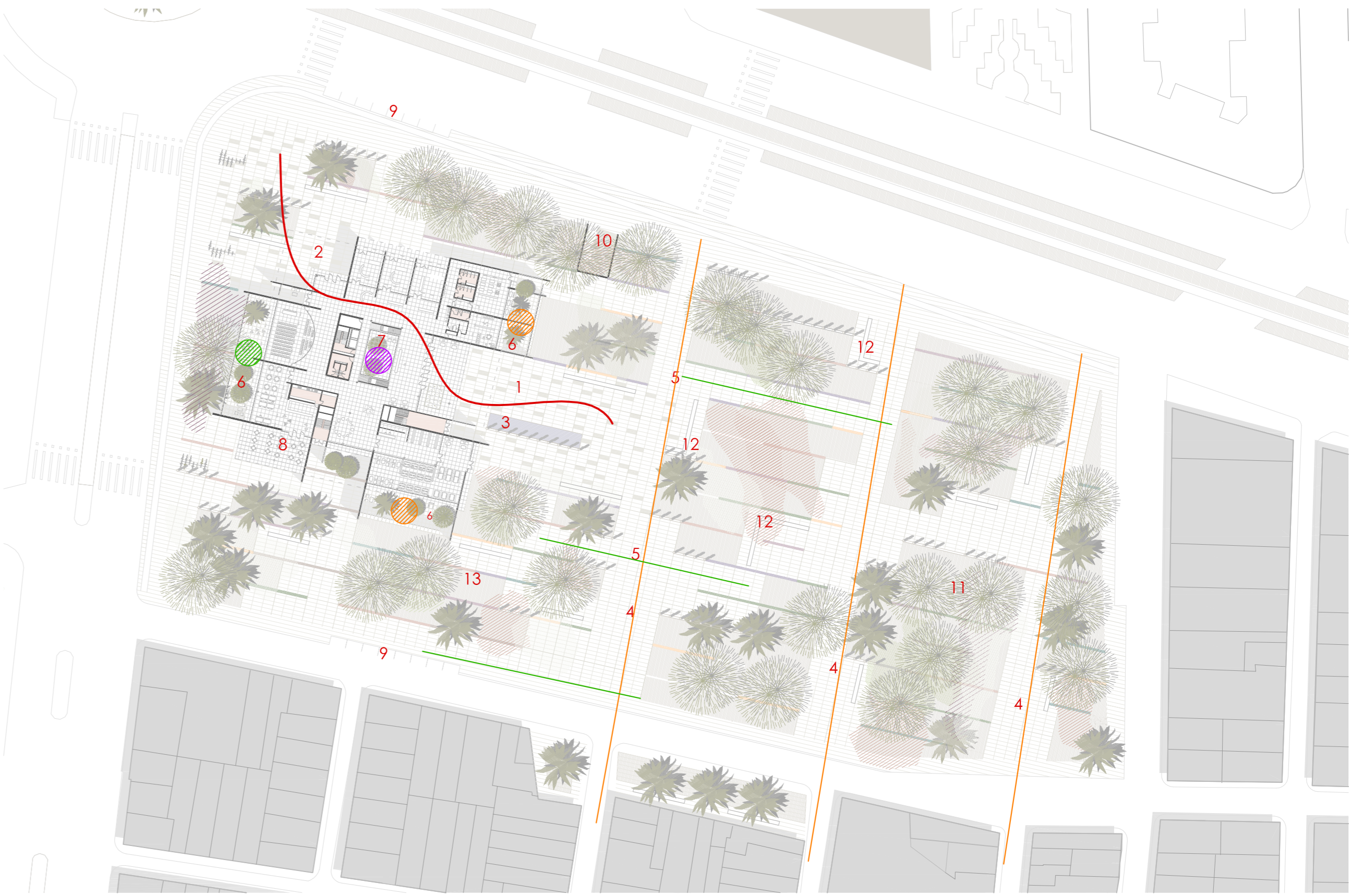
escala 1/ 1000