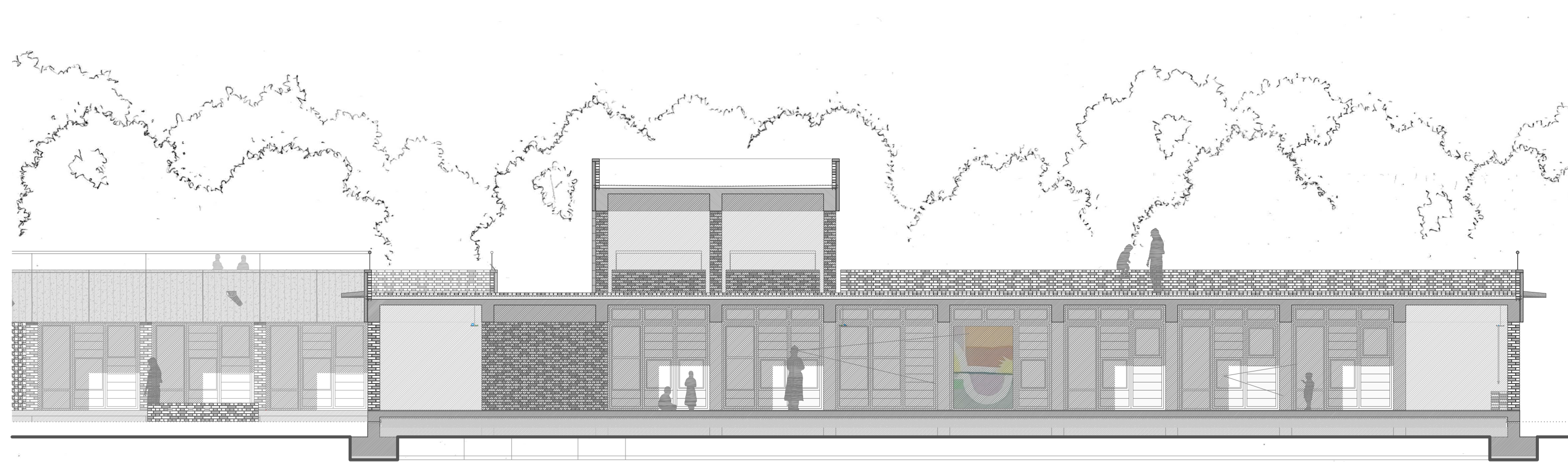
LA PROPUESTA Y SU CONSTRUCCIÓN