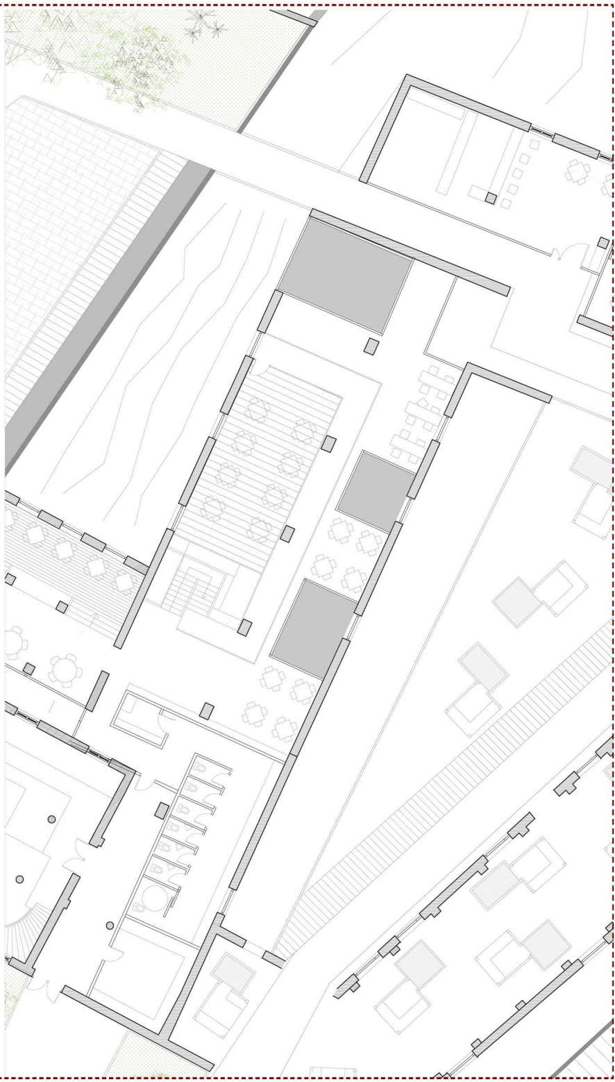
PLANTA BAJA RESTAURANTE