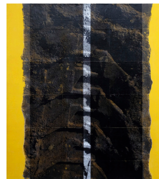
10. Travessies. 149 x 134cm. 2019