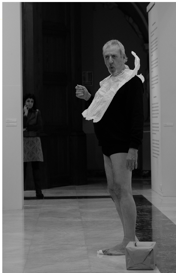
12. Petjada . Fundació Caixa Castelló. 2019.