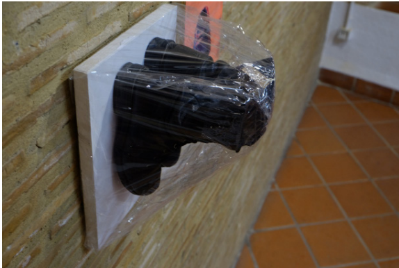
5. Flâneur . 30 x 23 x 35 cm. 2018