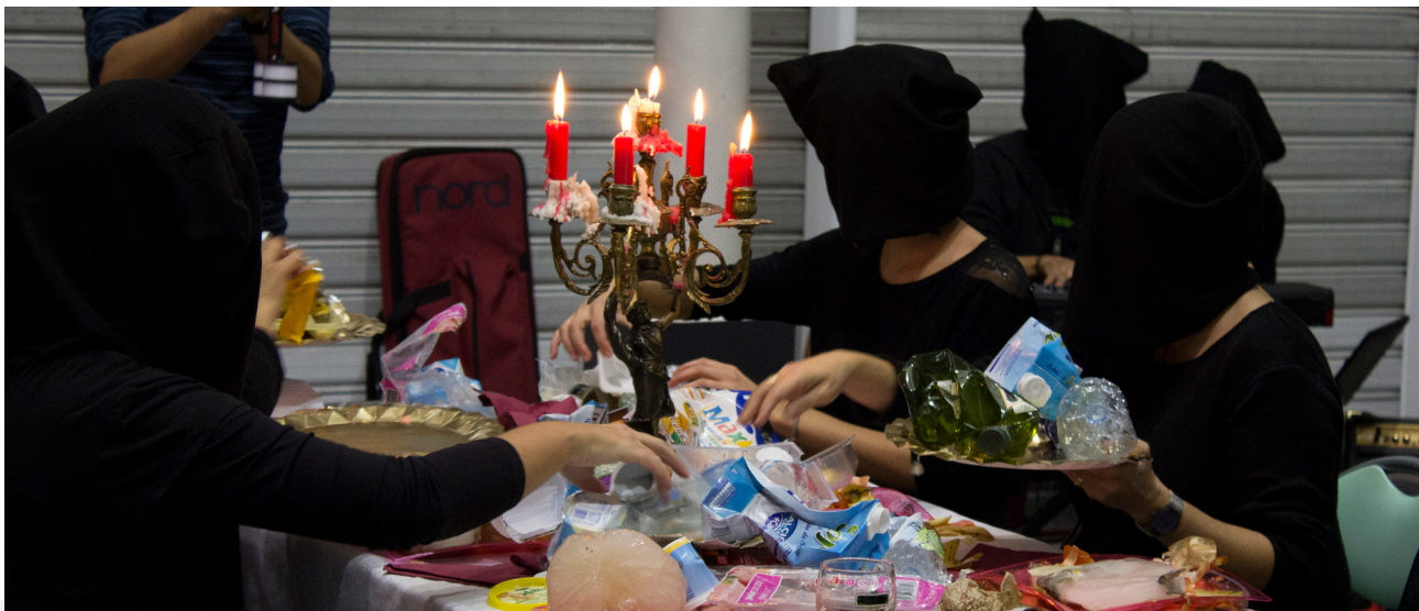
1. Foodtres. fotre's. Intramurs. 2016.