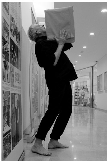
11. S/t. Martillopis biblioteca_18