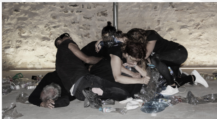
2. Tic tic plas plas. Espai d'art Contemporani. Riba-roja. 2017.