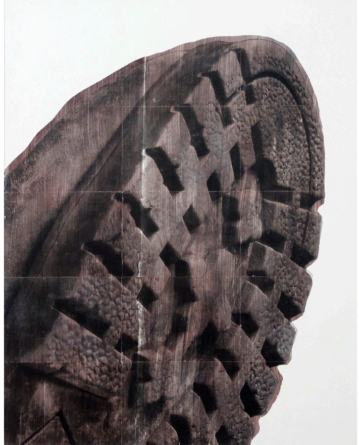
7. Tauró . 150 x 122 cm. 2017