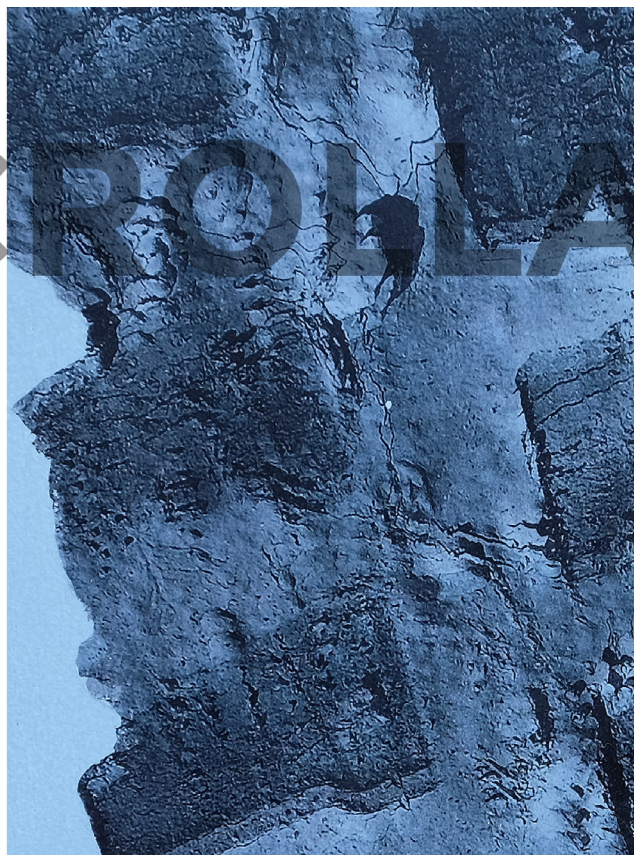
8. Boceto cartel: Escrollage. 2019