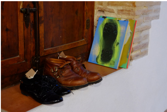
6. Instalación . 2018