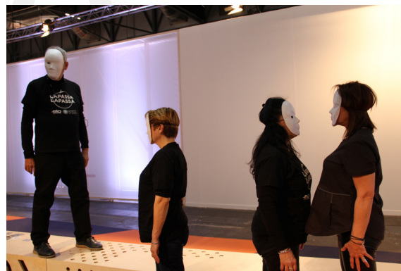
3. Mirar ver observar. Arco. 2019