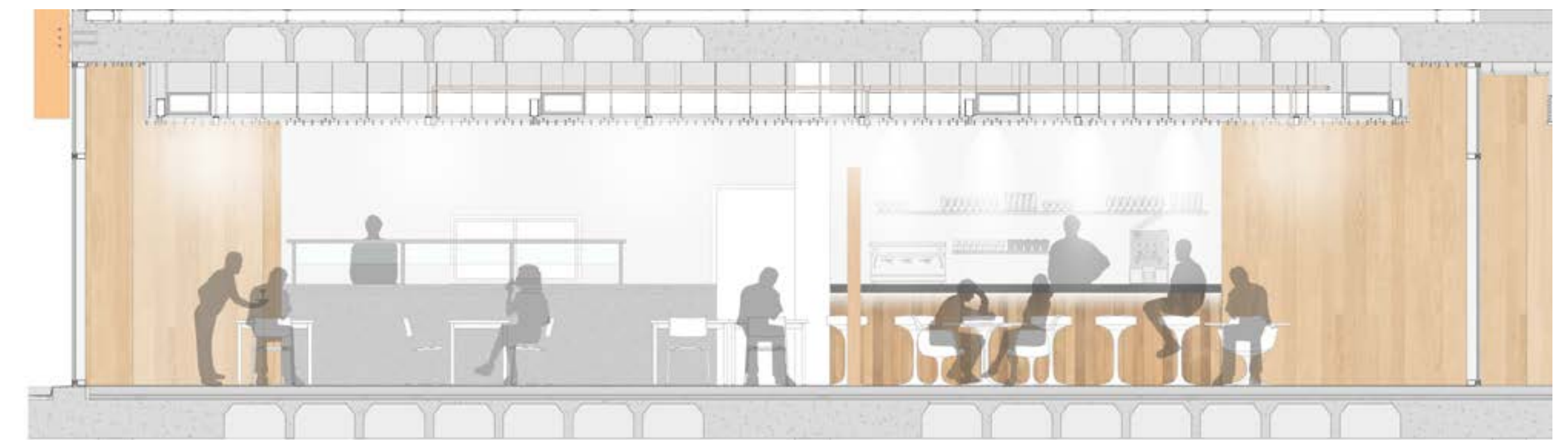
SECCION PORMENORIZADA DE LA CAFETERIA ESCALA 1:50