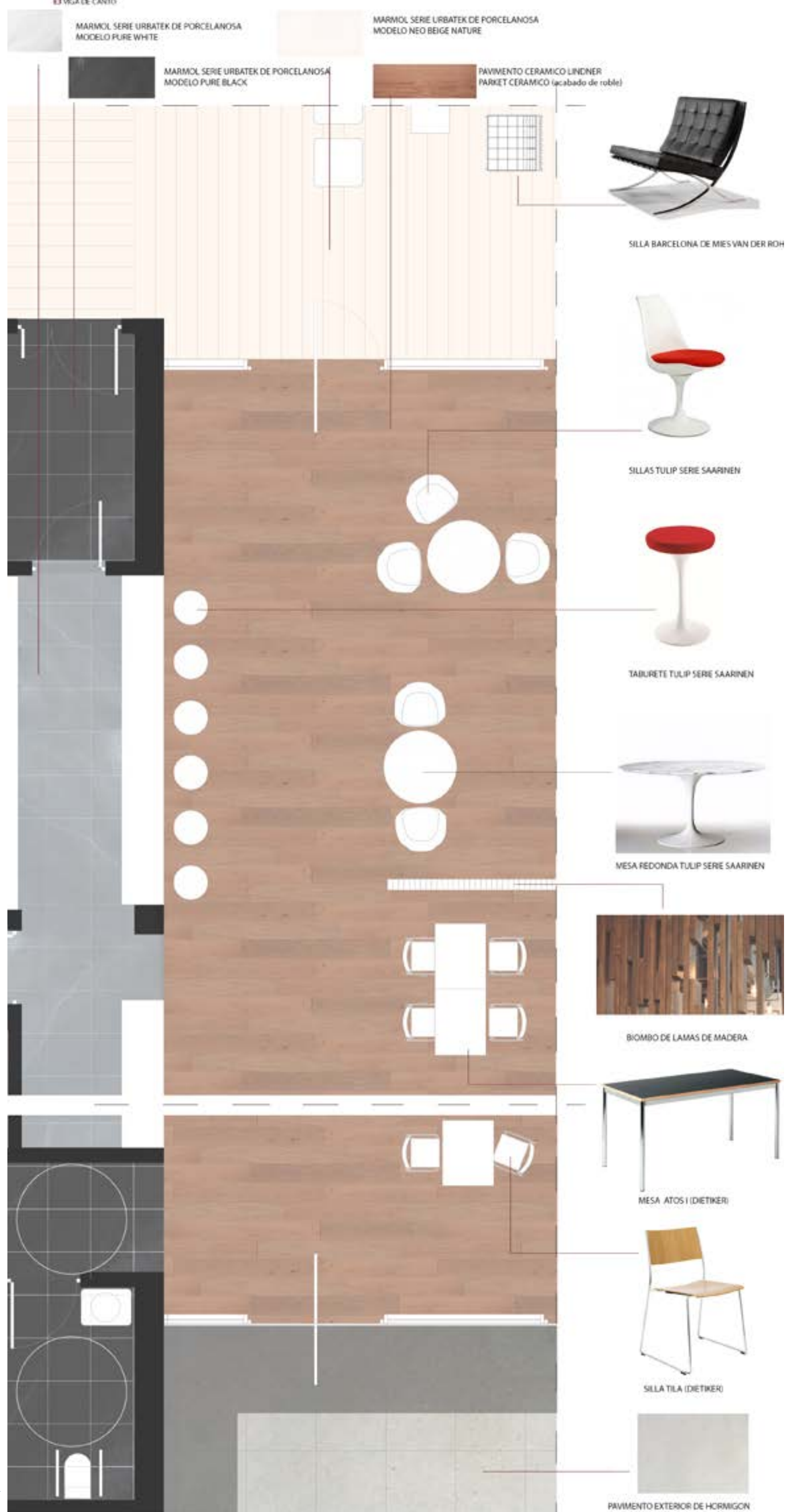
PLANTA PORMENORIZADA DE LA CAFETERIA ESCALA 1:50