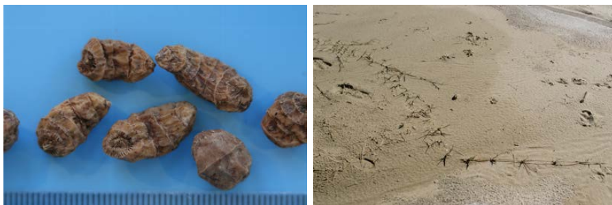
Figura 2: Propagación vegetativa: tubérculos de Cyperus sculentus (izquierda); estolón de Cynodon dactylon (derecha).

nando por emerger los cotiledones por encima de la superficie del suelo. De esta manera los cotiledones pasan a ejercer una segunda función que es la de comportarse como un primer par de hojas (hojas cotiledonares) que, mediante la fotosíntesis, facilitarán el desarrollo de la plántula. A continuación se desarrollan las hojas verdaderas por encima de los cotiledones. A este tipo de germinación se le denomina epígea (fig. 3).