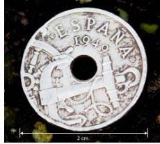
Figura 7: Moneda de 'Dos Reales' o 'Dos quinzets' (2 cm de diámetro).

contorno circular a oval, como ocurre en Sonchus oleraceus ), o porque puedan multiplicarse por semilla o vegetativamente (ej. Convolvulus arvensis ).