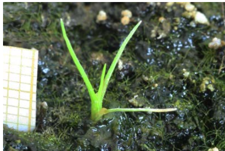
Figura 6: Plántula de Cyperus difformis (familia Cyperaceae , monocotiledónea).