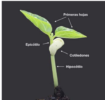
Figura 3: Plántula de especie dicotiledónea de germinación epígea ( Vigna sesquipedalis ).