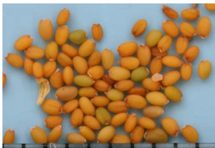
Figura 1: Semillas de ( Diplotaxis erucooides ).