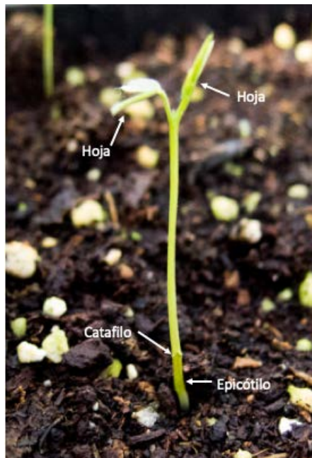
Figura 4: Plántula de Vicia villosa , especie dicotiledónea de germinación hipógea.