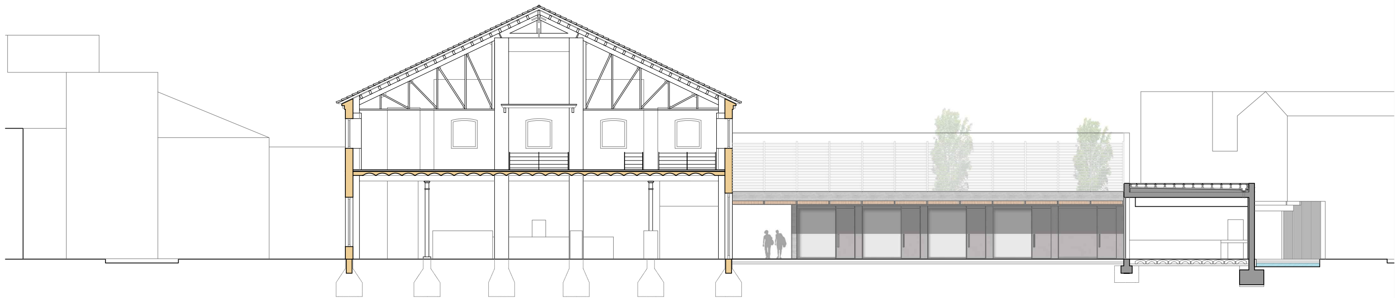
SECCIÓN NAVE EXPOSICIONES Y TIENDA E. 1:200

P01: PÉRFIL IPE 240 P02: CHAPA GRECADA 1MM P03: HORMIGÓN ARMADO, FORJADO CHAPA COLABORANTE P04: PAVIMENTO CONTINUO AUTONIVELANTE P05: PERFIL L 50X50X5MM P06: CONECTOR CHAPA GRECADA P07: PERFIL L 45X45X5MM P08: SOPORTE METÁLICO BARANDILLA