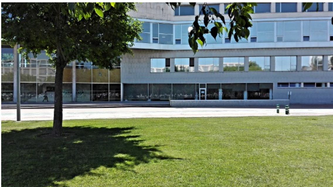
Imagen 1. Ubicación de la Unidad de Medio Ambiente, edificio Nexus UPV ( http://www.upv.es/entidades/AMAPUOC/noticia_997369c.html )

Es decir, en esta definición podemos encontrar su MISIÓN o razón de ser.