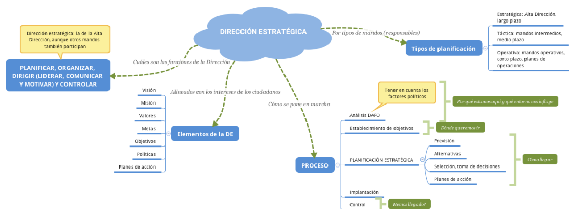
Figura 2. El proceso de Dirección estratégica, De Miguel, Bañón y Catalá (2017).

A lo largo de este objeto de aprendizaje hemos visto cómo realizar un análisis estratégico aplicándolo a un caso concreto. Esta fase, es la inicial dentro del proceso más complejo de dirección estratégica y que podemos ver en la siguiente figura.