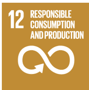
Imagen 2. Objetivo 12: Consumo y producción sostenibles

( https://www.un.org/sustainabledevelopment/wp-content/uploads/2018/09/Goal-12.pdf )