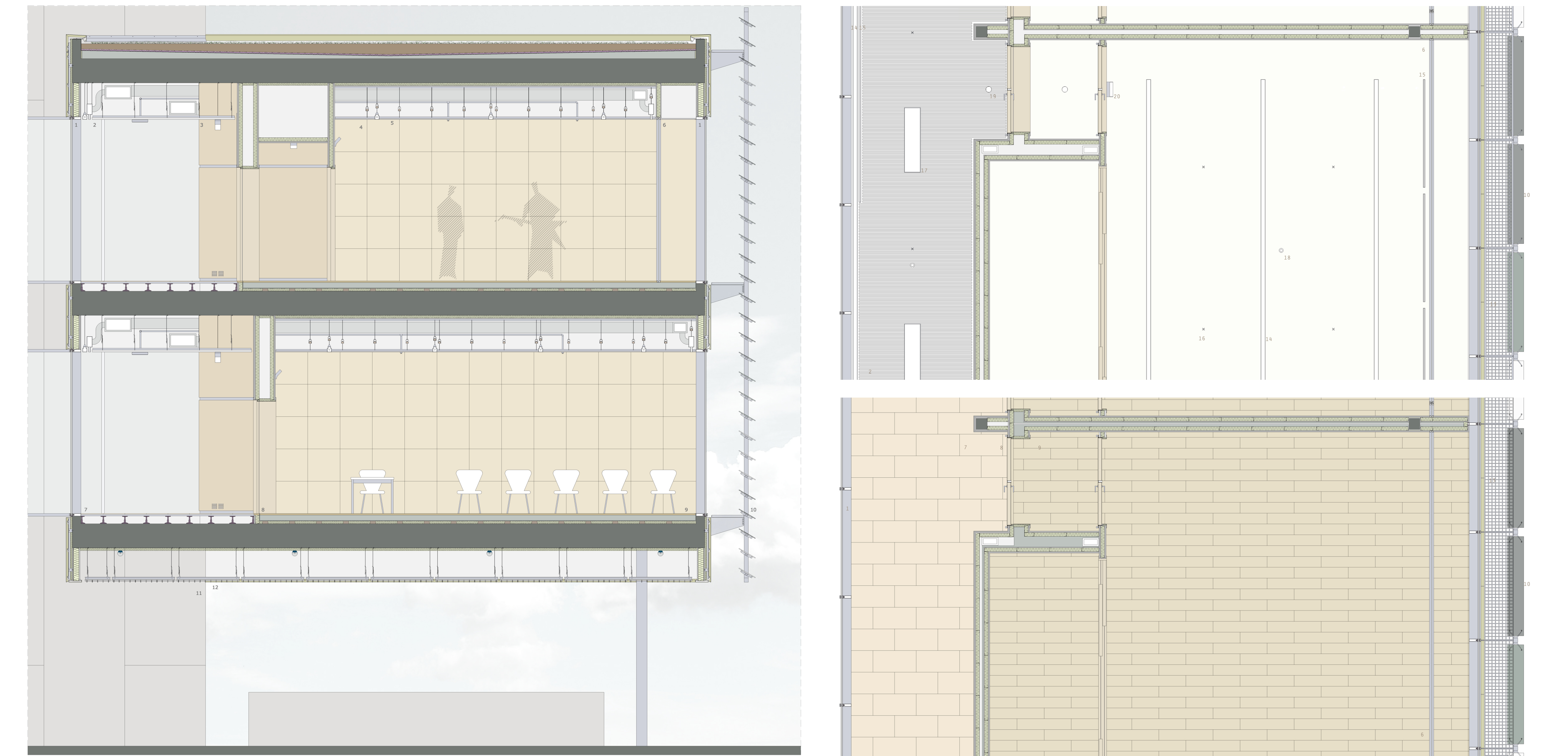
SALAS DE ENSAYO Y SEMINARIO