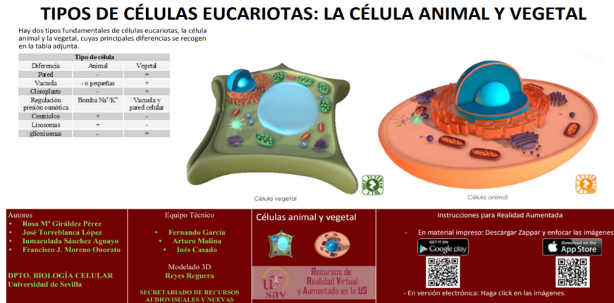
Figura 4. Ejemplo de guía.

Es de señalar que, los objetos producidos cuentan con una guía (Figura 4), en la cual se incorporan diferentes elementos para una correcta utilización por parte de los estudiantes o de otros profesores que tomen la decisión de utilizar el recurso; en dicha guía se describen diferentes aspectos, que van desde los objetivos que se persiguen, la zona de descarga de la app , forma en la cual se aconseja utilizar el recurso, o actividades que se pueden realizar tras su utilización.