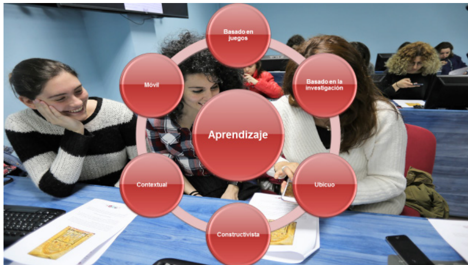
Figura 1. Modelos teóricos que le pueden dar cobertura teórica a la utilización educativa de la RA.

De todas formas, aun reconociendo la falta de cobertura teórica para justificar su incorporación a la enseñanza, tampoco se puede negar que se están llevando a cabo propuestas de utilización que parten de la idea de que las soluciones de incorporación no pueden residir en un único paradigma educativo, sino más bien en una mezcla de enfoques pedagógicos (Tarng y Ou, 2012; Bower et al. , 2014). Y, en este sentido, el aprendizaje constructivista, aprendizaje situado, aprendizaje inductivo, y aprendizaje basado en juegos son los que se presentan con fuertes posibilidades para la fundamentación. Por otra parte, la teoría de la variación, formulada inicialmente por Mazur (1997), sugiere que las situaciones enriquecedoras del aprendizaje son aquellas que ponen en una situación al estudiante donde tiene que experimentar o analizar para cambiar su concepción inicial, y donde también puede aportar pistas y sugerencias para su utilización educativa. En este sentido, existen una síntesis de las teorías de aprendizaje en las cuales se puede apoyar su utilización educativa (Figura 1).