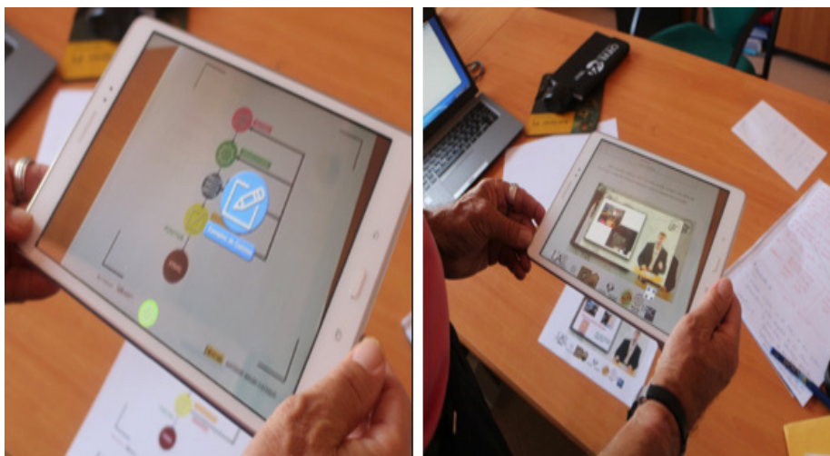
Figura 2. Ejemplos de apuntes enriquecidos con objetos de RA.

Esta modalidad ha sido analizada en diferentes investigaciones realizadas en el proyecto RAFODIUN (Figura 2), encontrándose su fuerte aceptación por parte de los estudiantes, el aumento de la motivación, y la facilidad de adquisiciones de los contenidos presentados (Garay, Tejada y Castaño, 2017; Garay, Tejada y Maiz, 2017; Cabero y Barroso, 2018).