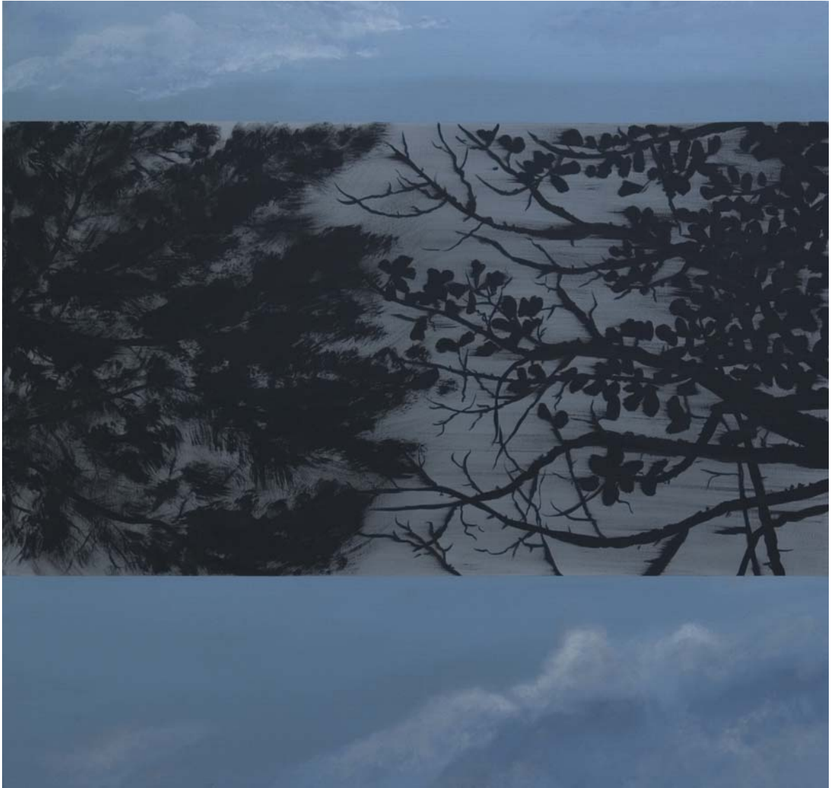
Ramas de algarrobo y pino que superan al Cielo 120x115 cm Acrílico y pigmento sobre tela