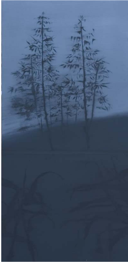
Novias y Cañas 120x56 cm Acrílico y pigmento sobre tela