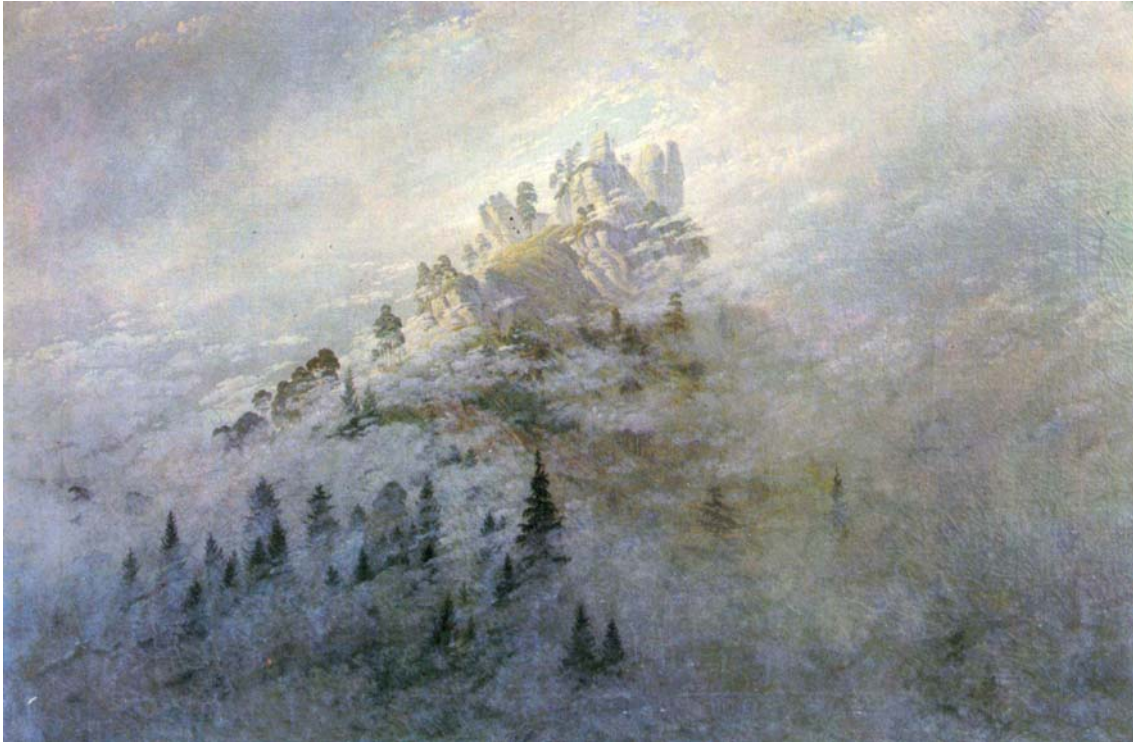
Caspar David Friedrich: Morgennebel im Gebirge. 1808, óleo sobre lienzo, 71 x 104 cm. Rudolstadt, Museum Schloß Heidecksburg