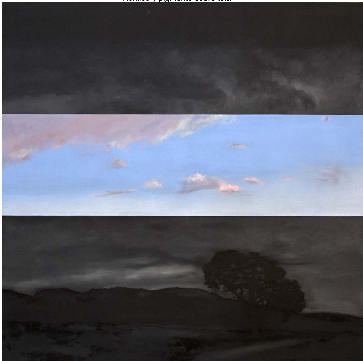
El cielo de Tiépolo. El pino que sobrevive. 146x146 cm