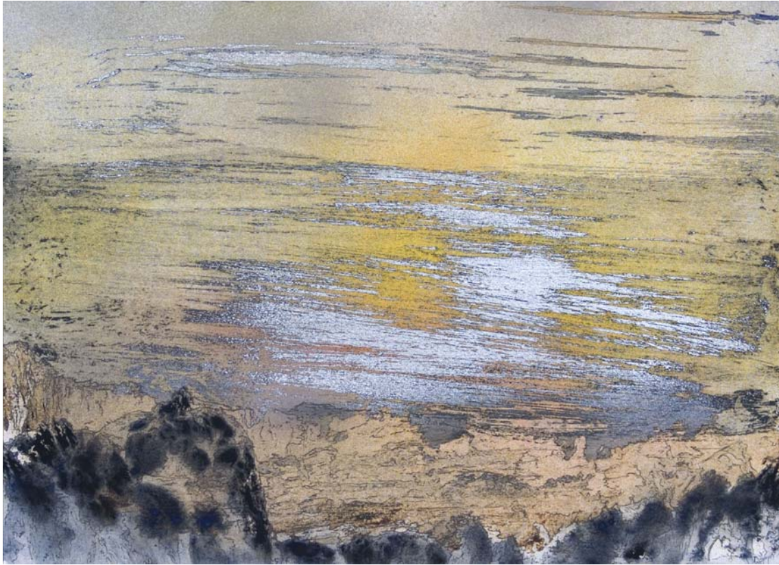
Puesta de sol con nubes plateadas sobre un valle rocoso. 24 x 33 cm Rotulador, acrílico, spray y pigmento sobre papel.