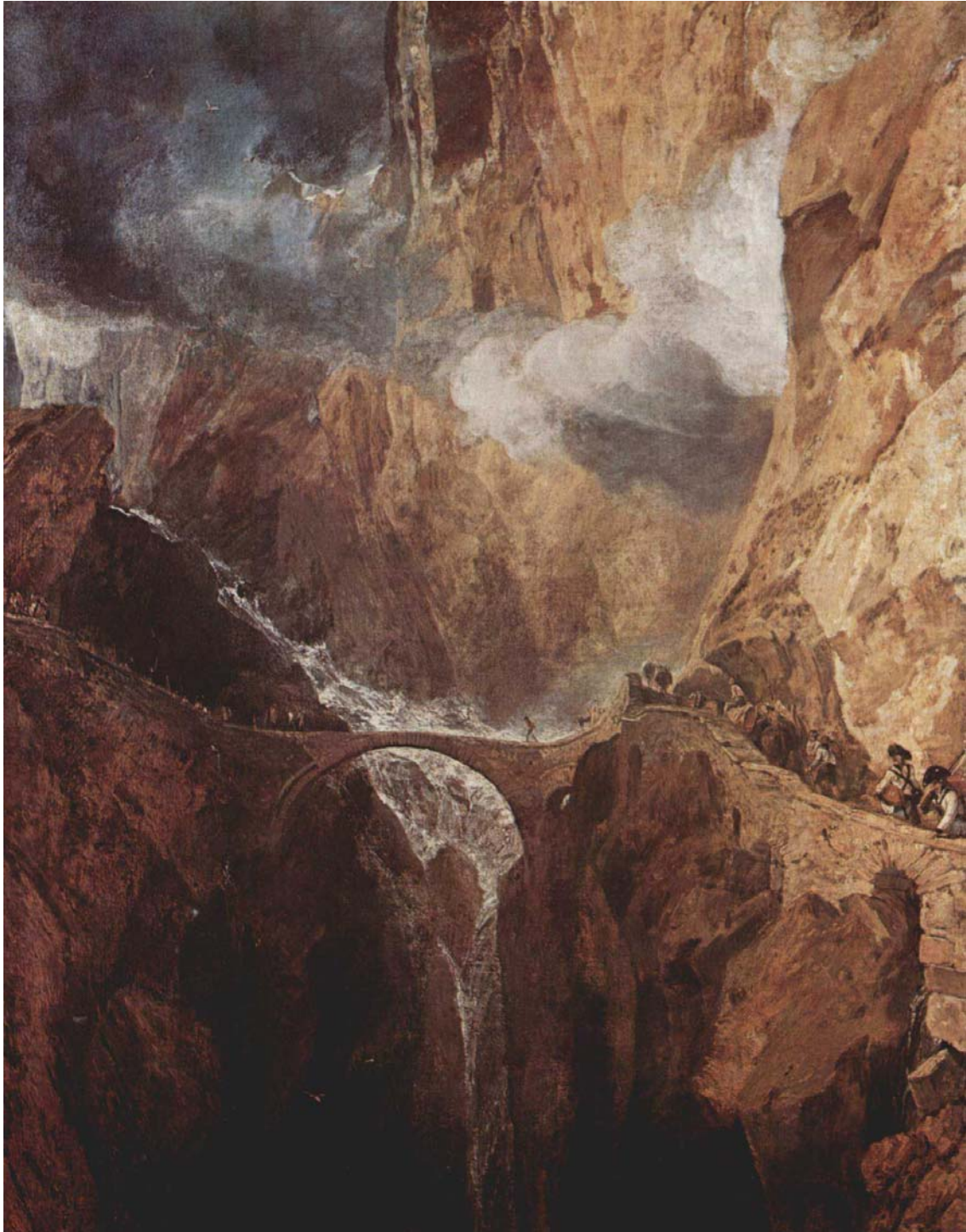
Joseph Mallord William Turner: Die Teufelsbrücke St. Gotthard. Alrededor de 1803 – 1804, óleo sobre lienzo, 76,8 x 62,8 cm, Zürich, Kunsthaus