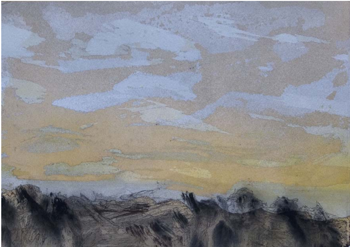
Nubes que cubren el cielo en espesos girones. 24 x 33 cm Rotulador, acrílico, spray y pigmento sobre papel.