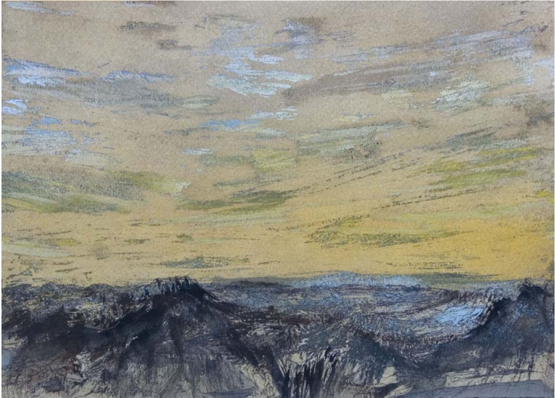
Nubes en la lejanía. 24 x 33 cm Rotulador, acrílico, spray y pigmento sobre papel.