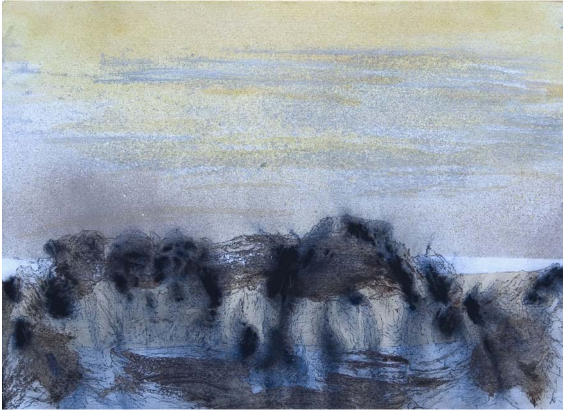
Extrañas formaciones que se dispersan y generan movimiento. 24 x 33 cm Rotulador, acrílico, spray y pigmento sobre papel.