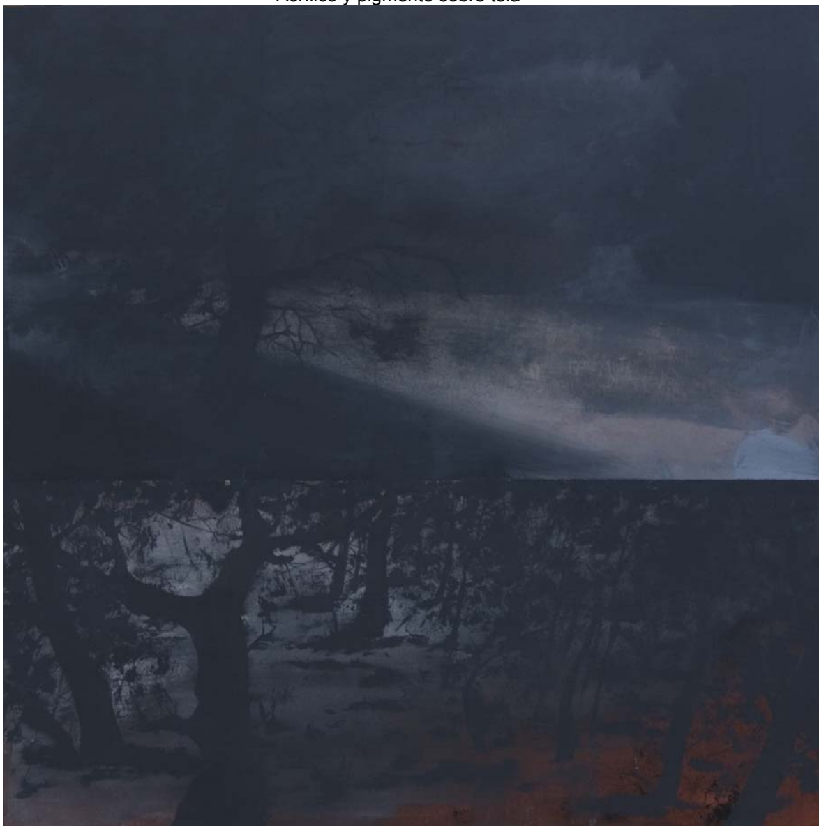
Árbol destronado. Pinos y Algarrobo del Barranco 120x120 cm