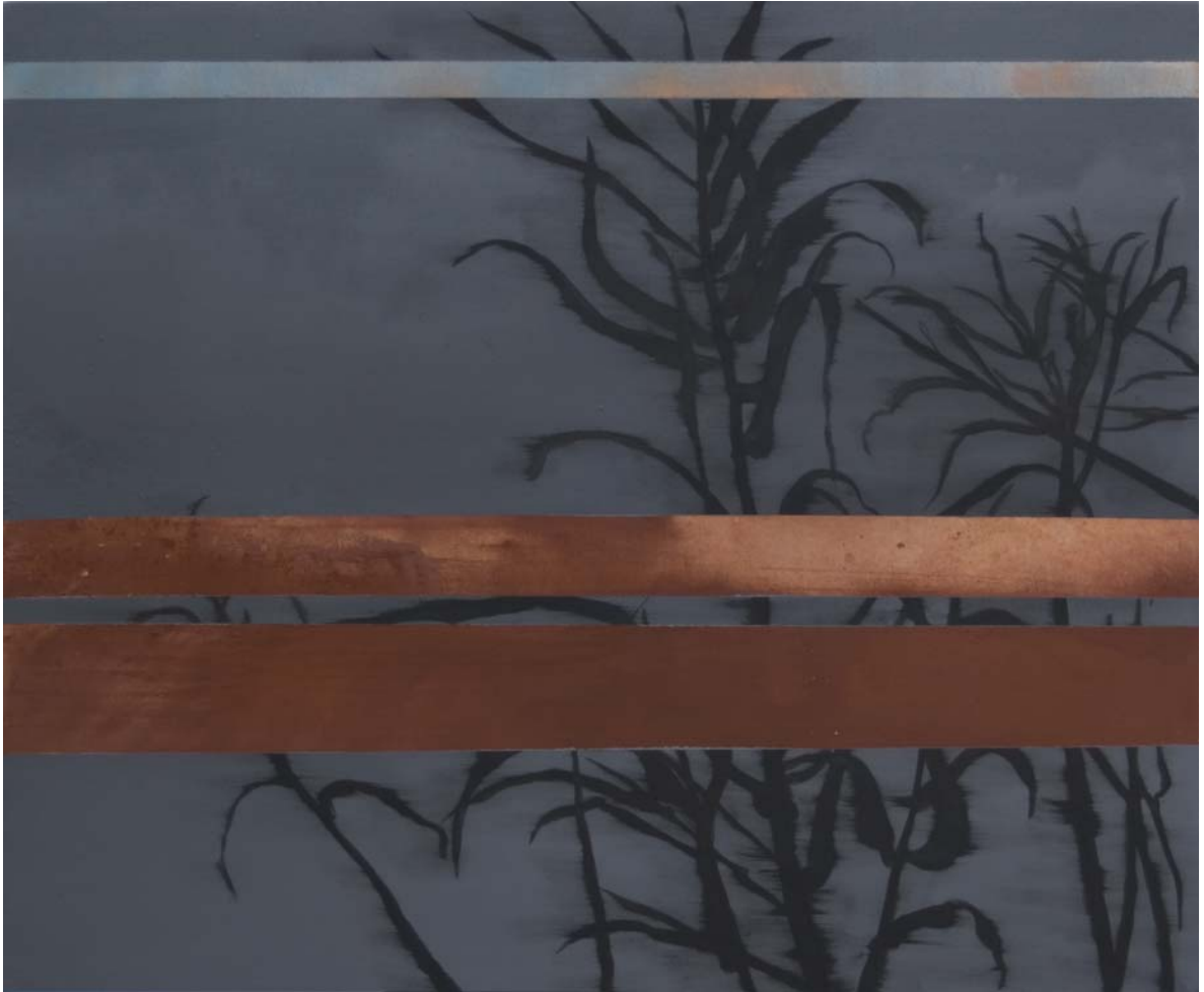
Cañas y Almagra, El Carraixet 110x120 cm Acrílico y pigmento sobre tela