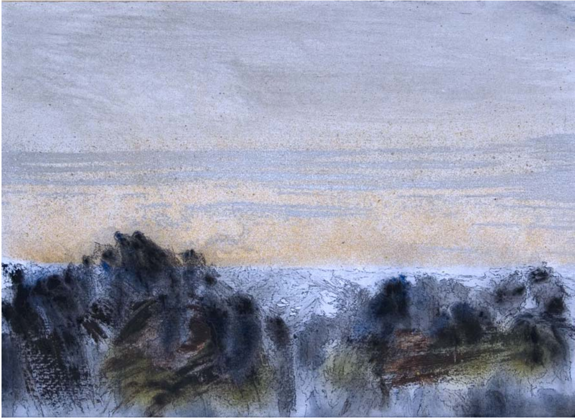
Una nube traspasa el final del día. 24 x 33 cm Rotulador, acrílico, spray y pigmento sobre papel.