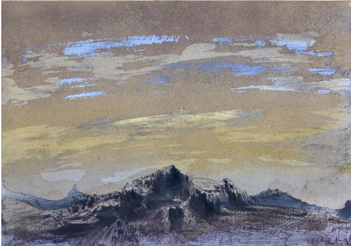
El pico de la montaña. 24 x 33 cm Rotulador, acrílico, spray y pigmento sobre papel.