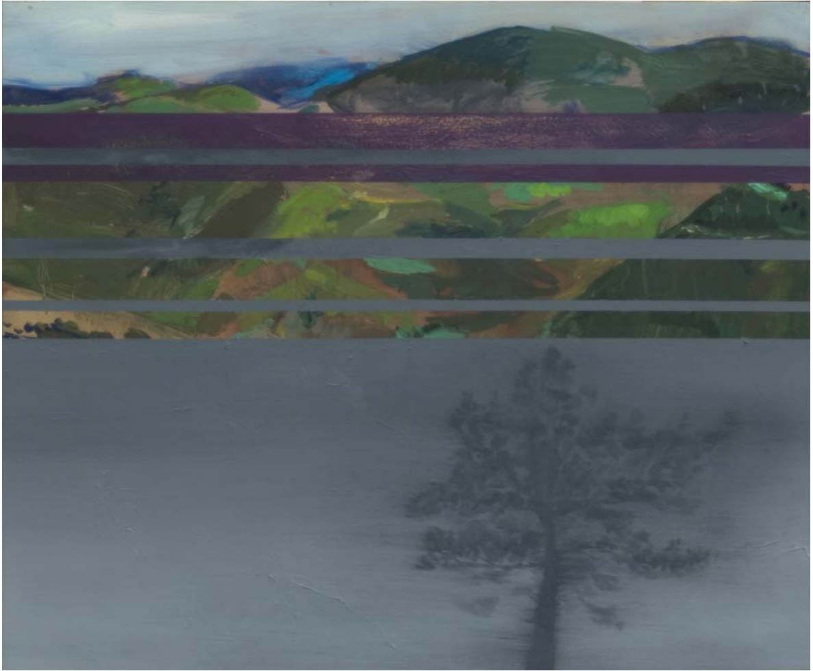
Un pino frente a unas montañas. Algo que se tapa. 40x50 cm Óleo y pigmento sobre tabla