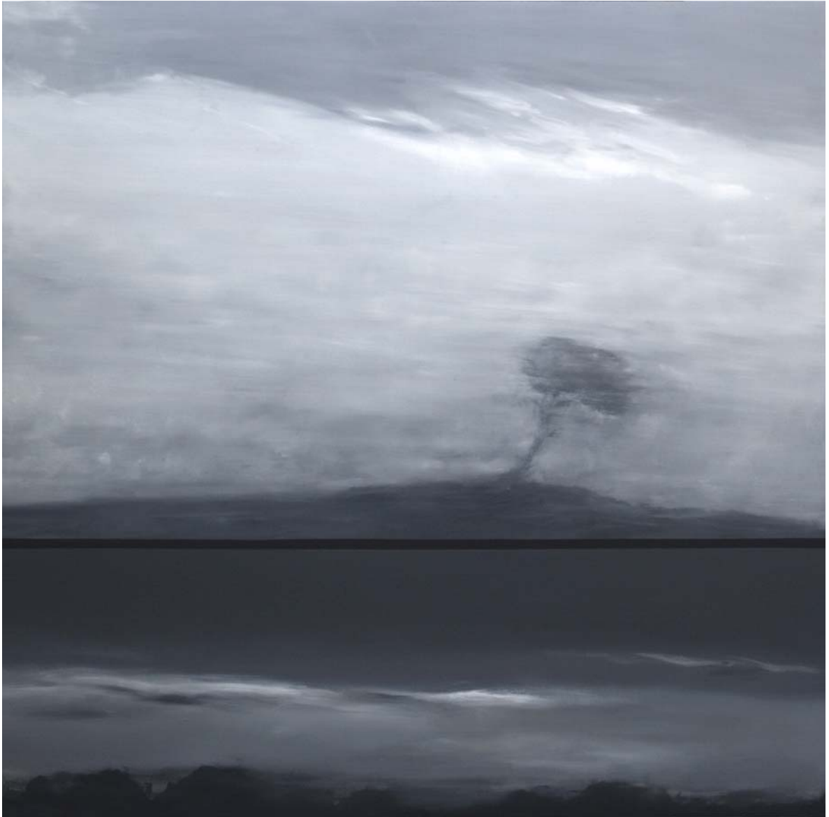
Dos Visiones 196x196 cm