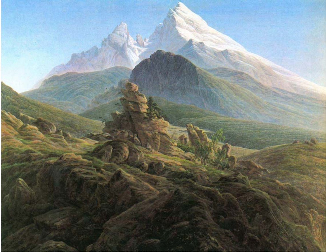
Caspar David Friedrich: Der Watzmann. Alrededor de 1824 – 1825, óleo sobre lienzo, 133 x 170 cm, Berlín, Alte Nationalgalerie