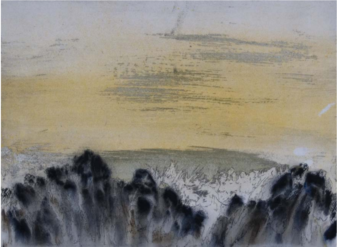
Las montañas, al finalizar la tarde, con unos girones plateados. 24 x 33 cm Rotulador, acrílico, spray y pigmento sobre papel.