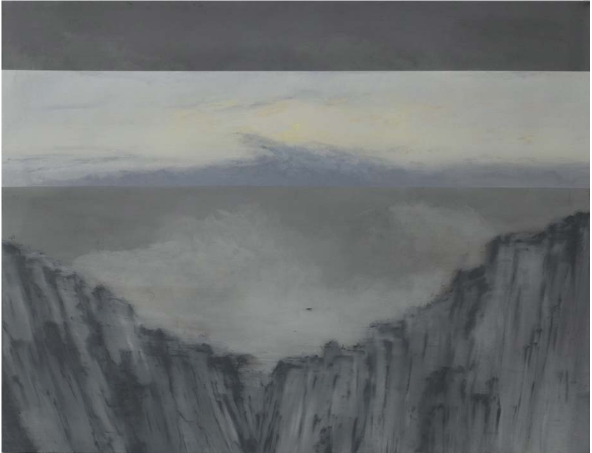
Luz a las nueve de la noche, frente a montañas, árbol y pájaro. 114x146 cm Acrílico, óleo y pigmento sobre tela