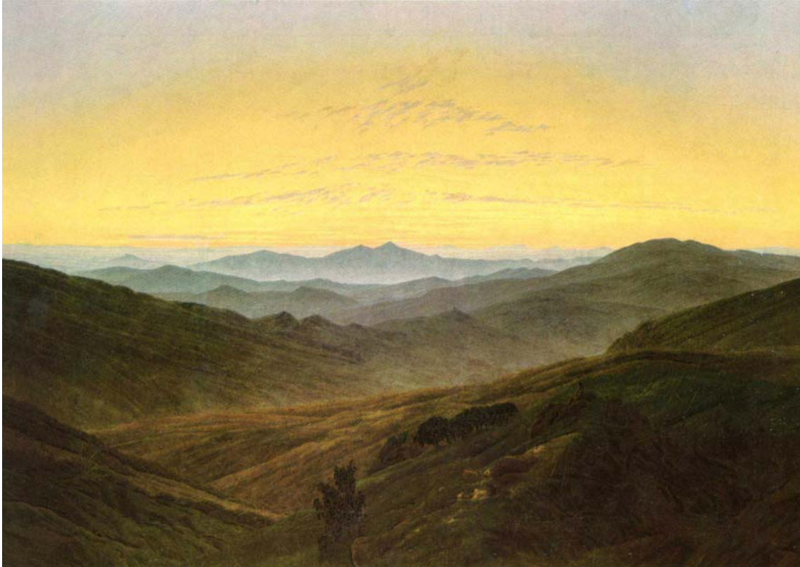
Caspar David Friedrich: Landschaft im Charakter des böhmischen Mittelgebirges (Riesengebirge). Alrededor de 1830 – 1835, óleo sobre lienzo, 72 x 103 cm