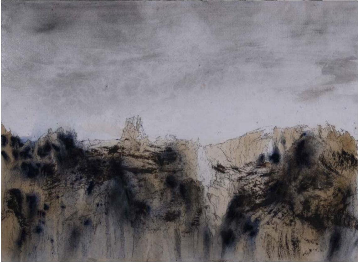
Acantilado con cielo grisáceo, pesado. 24 x 33 cm Rotulador, acrílico, spray y pigmento sobre papel.