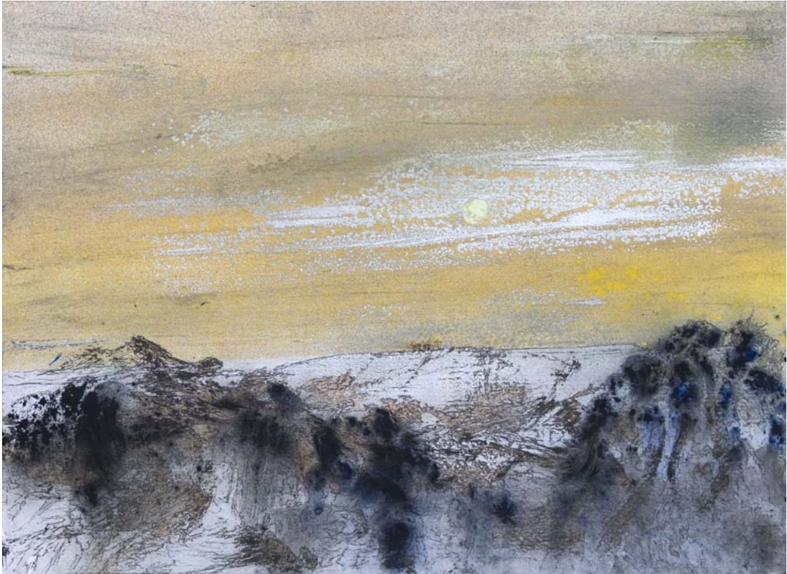
Cumbres y rocas que aparecen en medio de un sol lunar. 24 x 33 cm Rotulador, acrílico, spray y pigmento sobre papel.