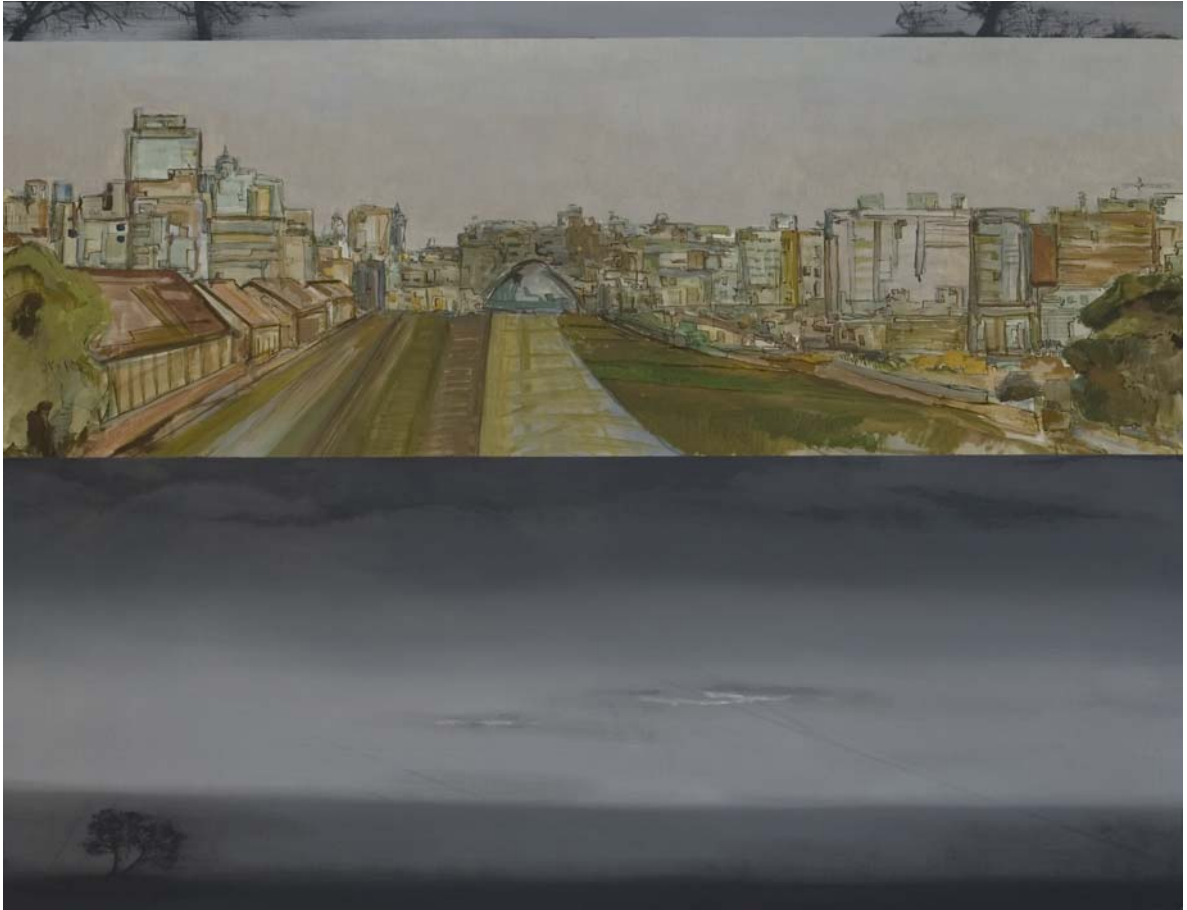
Estación del Norte. Pinos arrastrados por el viento 114x146 cm Óleo, acrílico y pigmento sobre tela