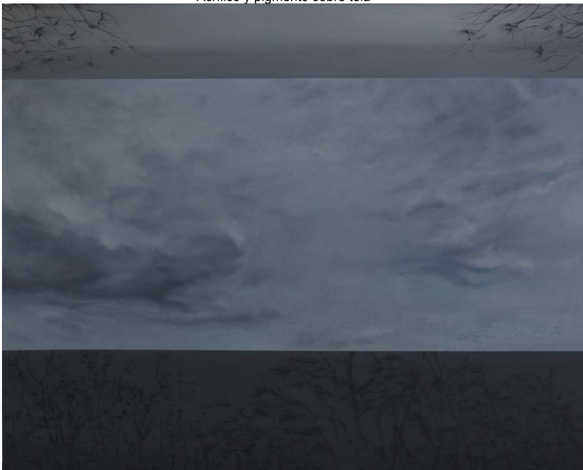
Mirando al Cielo. Briznas que vuelan al Viento 190x240 cm