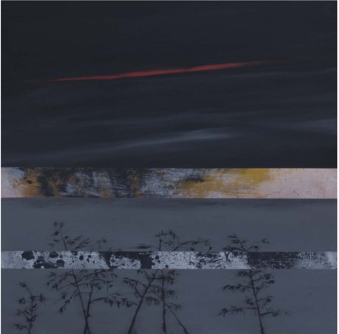
Hierbajos, Paisaje en Movimiento, Árbol tapado 120x120 cm Acrílico y pigmento sobre tela