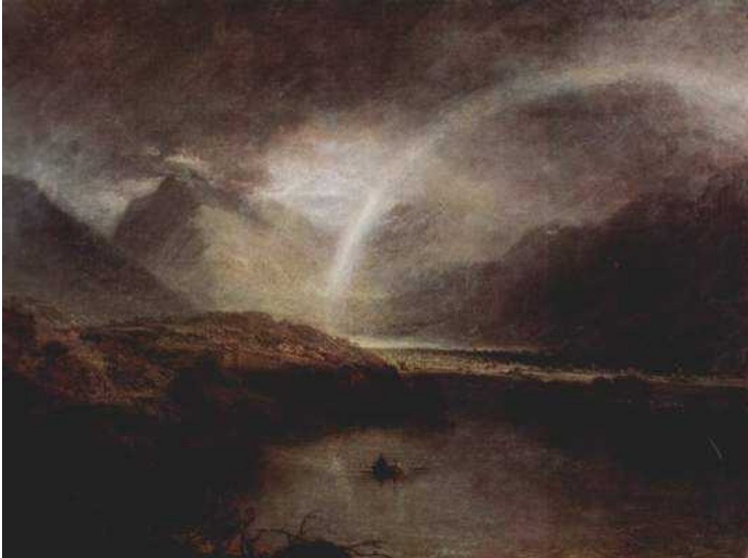
Joseph Mallord William Turner: Buttermere-See mit Teilansicht von Cromackwater, Cumberland 1798, óleo sobre lienzo, 91,5 × 122 cm. London, Tate Gallery.