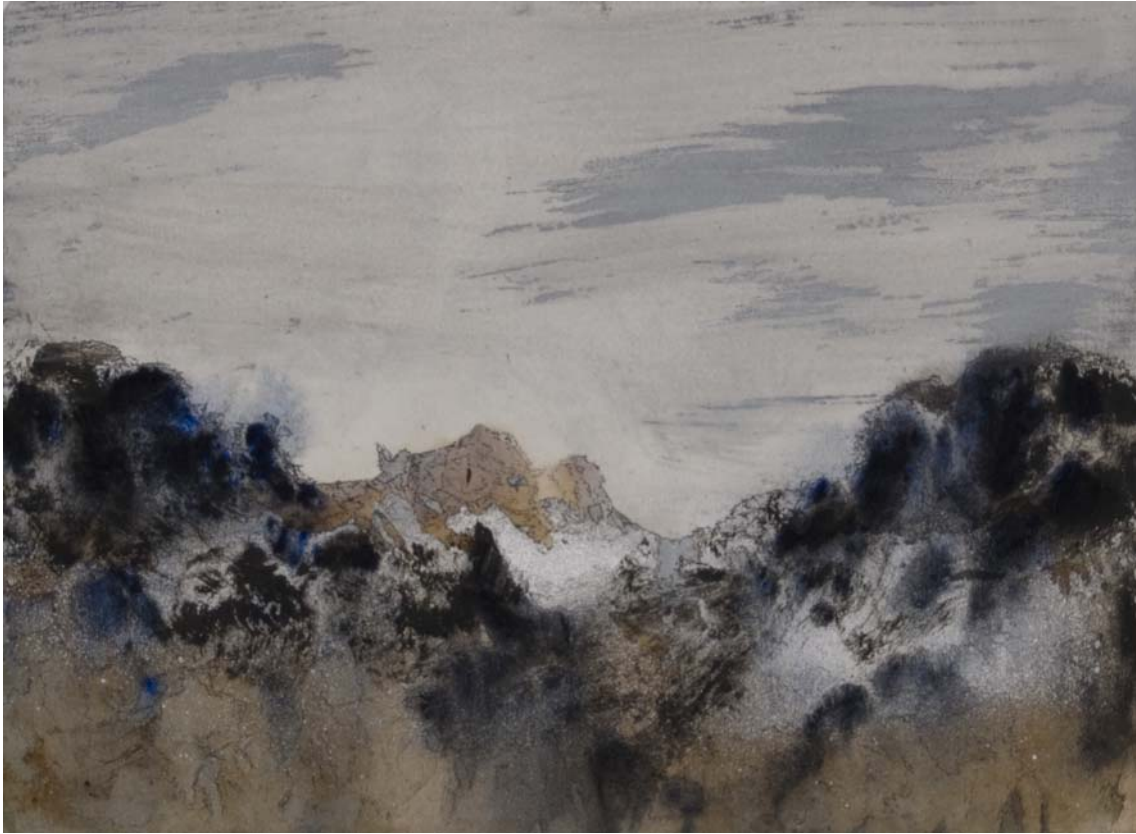
Colinas rocosas que aparecen entre dos montañas. 24 x 33 cm Rotulador, acrílico, spray y pigmento sobre papel.