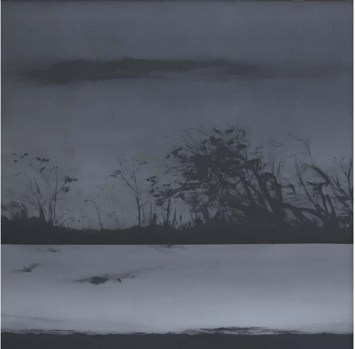
Mirando a través de la hierba 196x196 cm