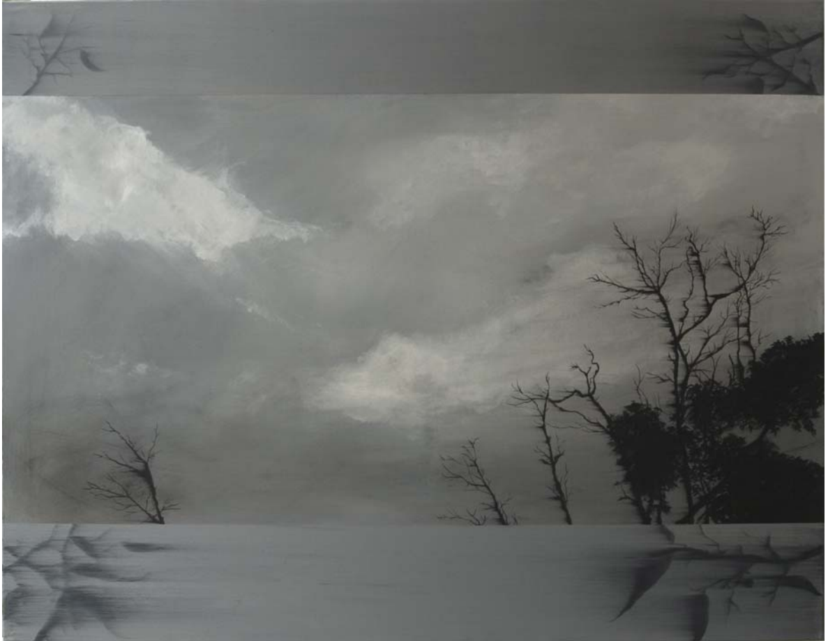
Eucalipto muerto 114x146 cm Acrílico, óleo y pigmento sobre tela