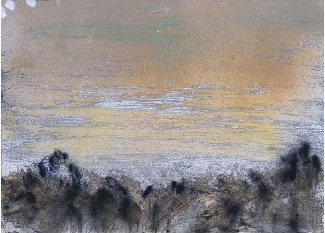
Sendos picos a últimas horas del atardecer. 24 x 33 cm Rotulador, acrílico, spray y pigmento sobre papel.