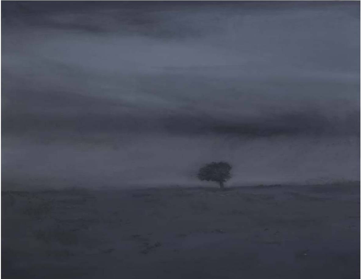
Encina en la pradera con Tormenta 114x146 cm Óleo sobre tela