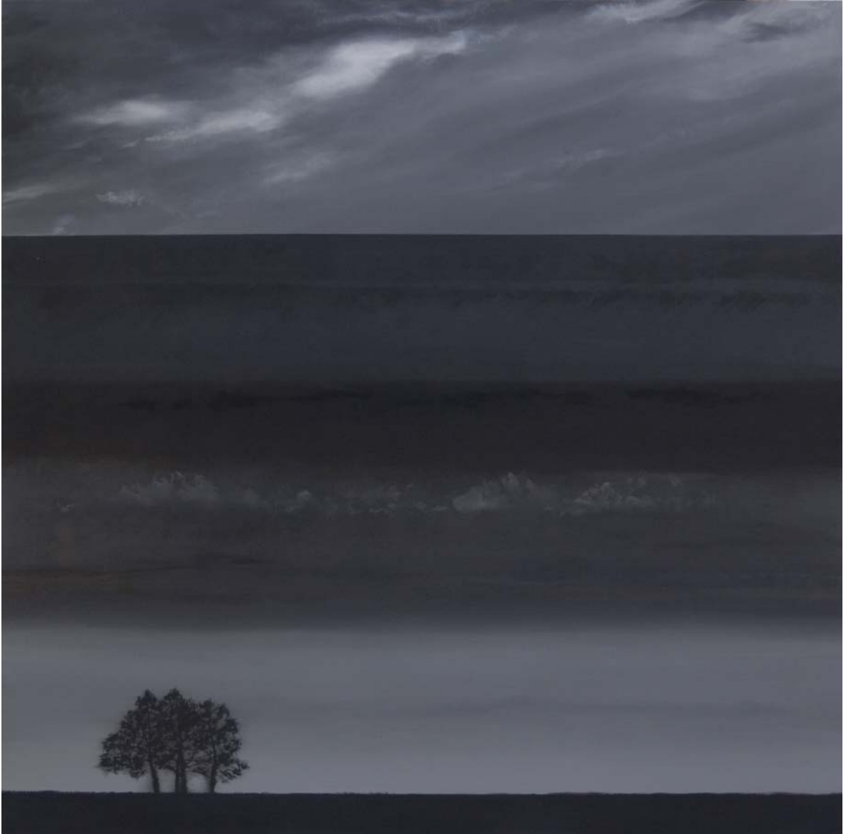
Pinos al atardecer 185x188 cm