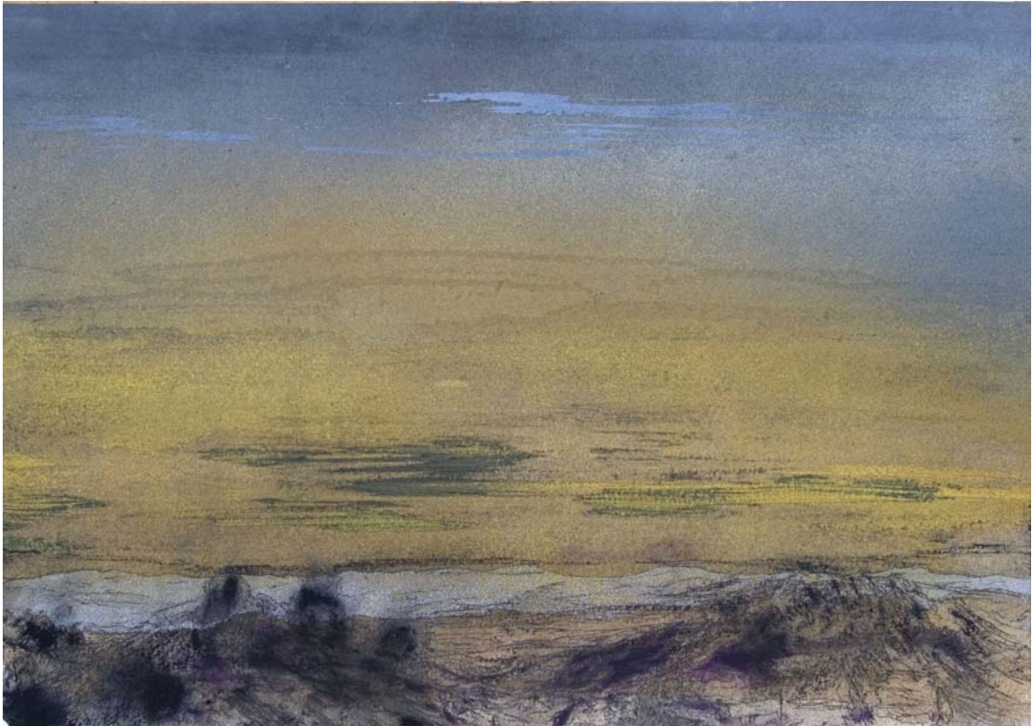
Casi anochecer azulado. 24 x 33 cm Rotulador, acrílico, spray y pigmento sobre papel.