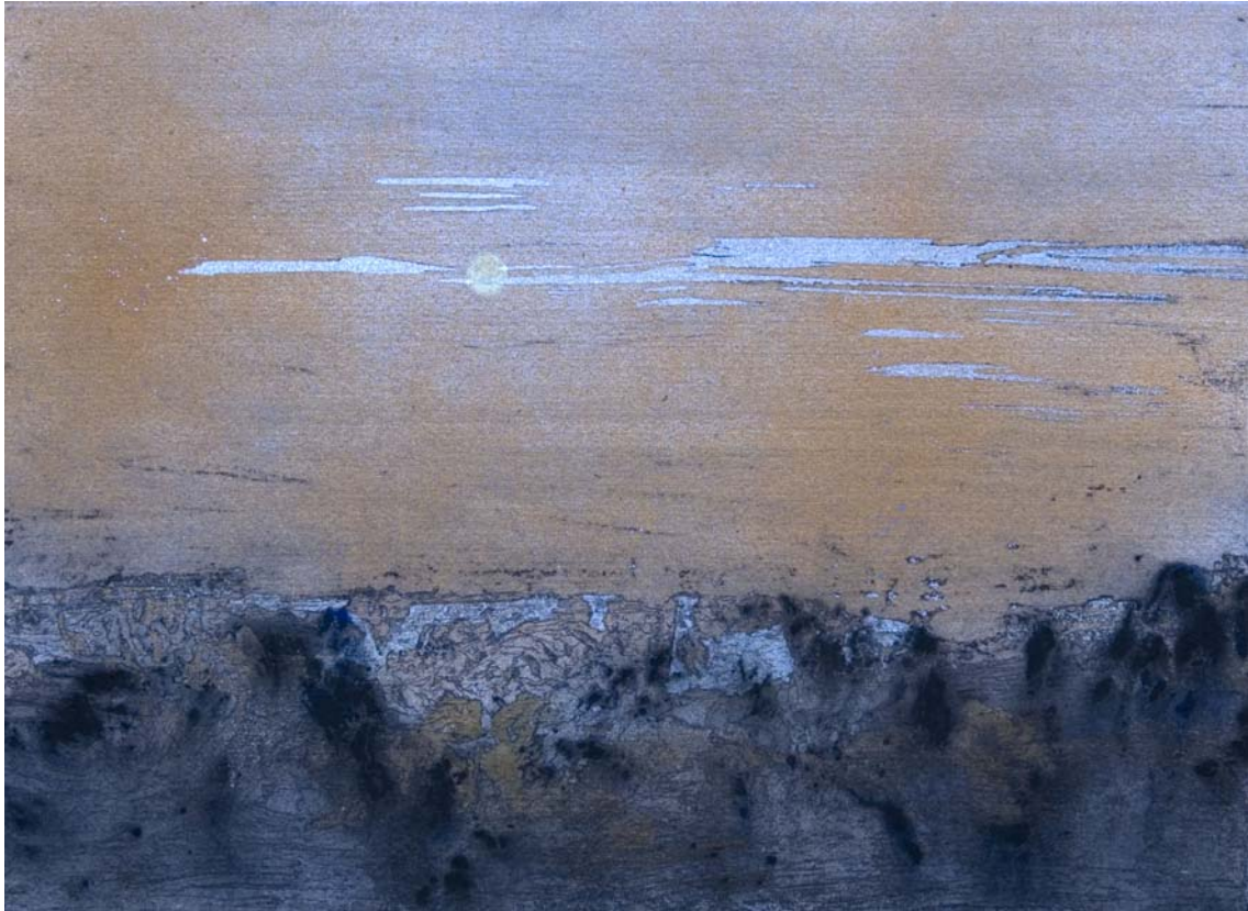
Luna cortada al primer anochecer anaranjado. 24 x 33 cm Rotulador, acrílico, spray y pigmento sobre papel.