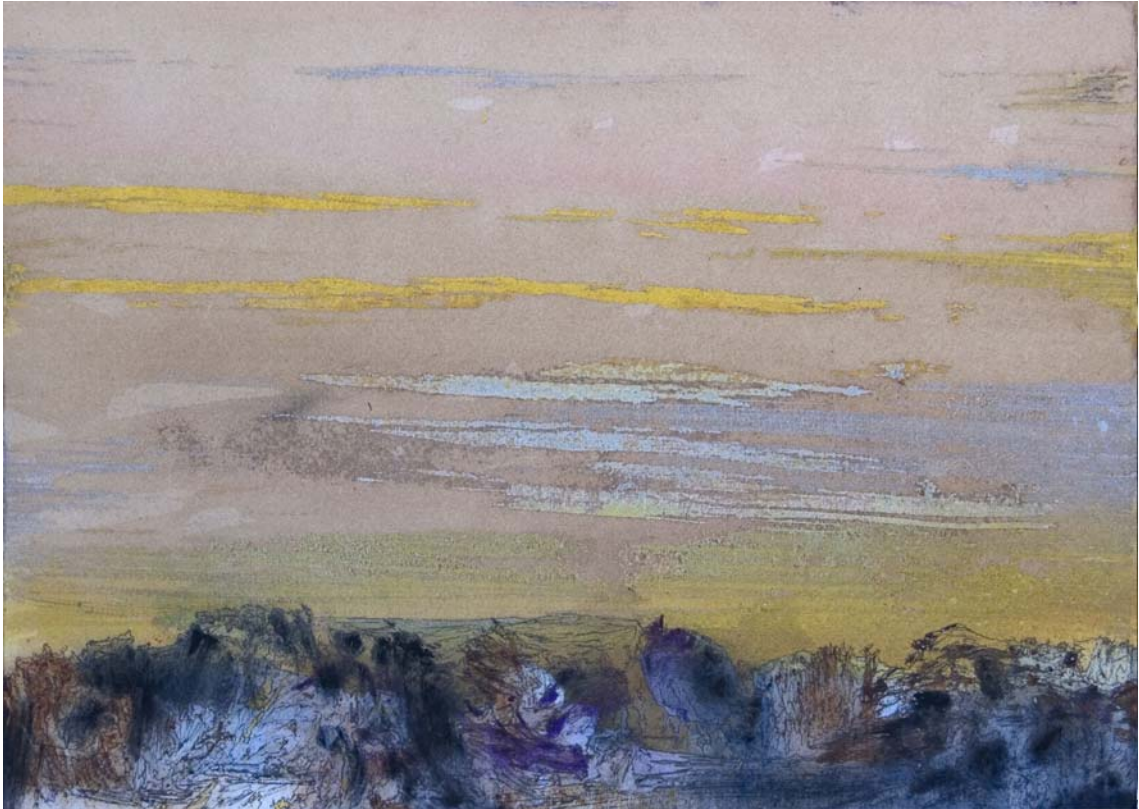
Rocas diversas con nubes doradas cruzando el cielo. 24 x 33 cm Rotulador, acrílico, spray y pigmento sobre papel.