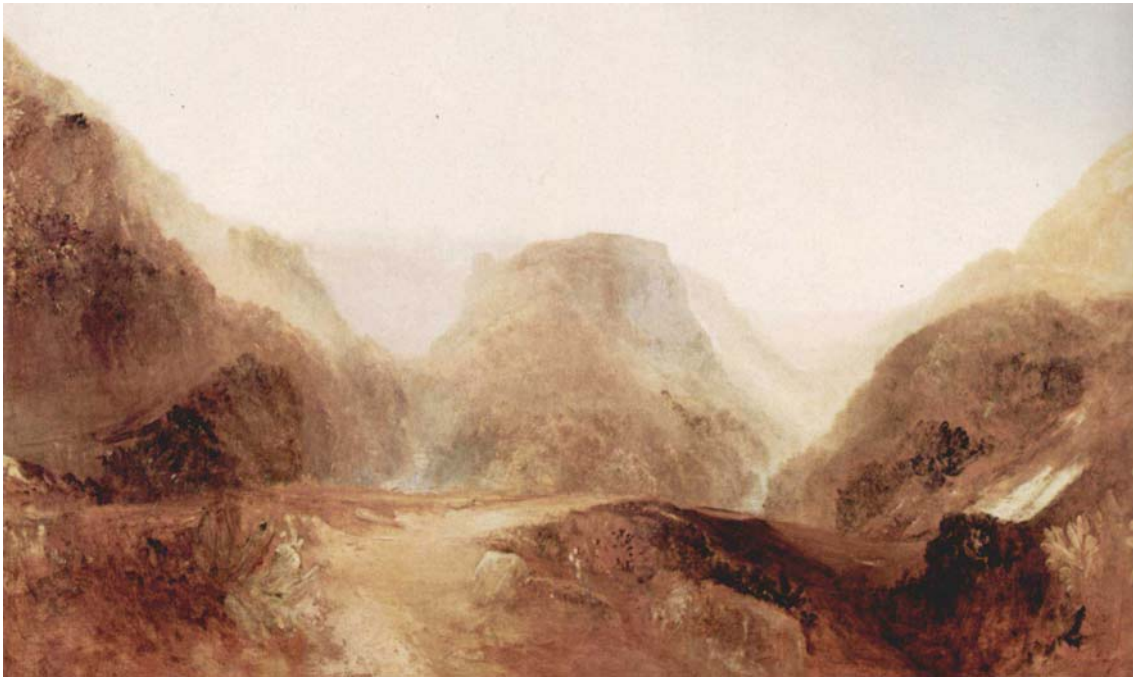
Joseph Mallord William Turner: Italienische Landschaft. Alrededor de 1828, óleo sobre lienzo, 150 x 249,5 cm, London, Tate Gallery