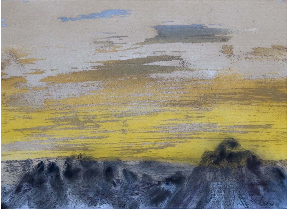
Puesta de sol dorada con montañas que asoman. 24 x 33 cm Rotulador, acrílico, spray y pigmento sobre papel.