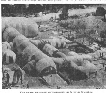
Vista general en proceso de construcción de la red de hinchables