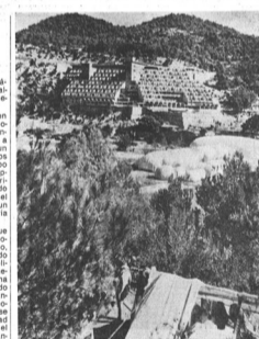
En primer término los hinchables de la Ciudad Instantánea, al fondo los hoteles. Obra del arquitecto Ramon Torres