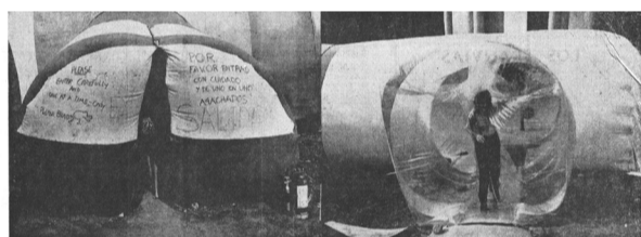
Acceso a la Ciudad Instantánea ideados por los estudiantes del modo más económico y siempre con una absoluta realización manual

F. Bendito, C. Ferrater, J.M. de Prada Poole