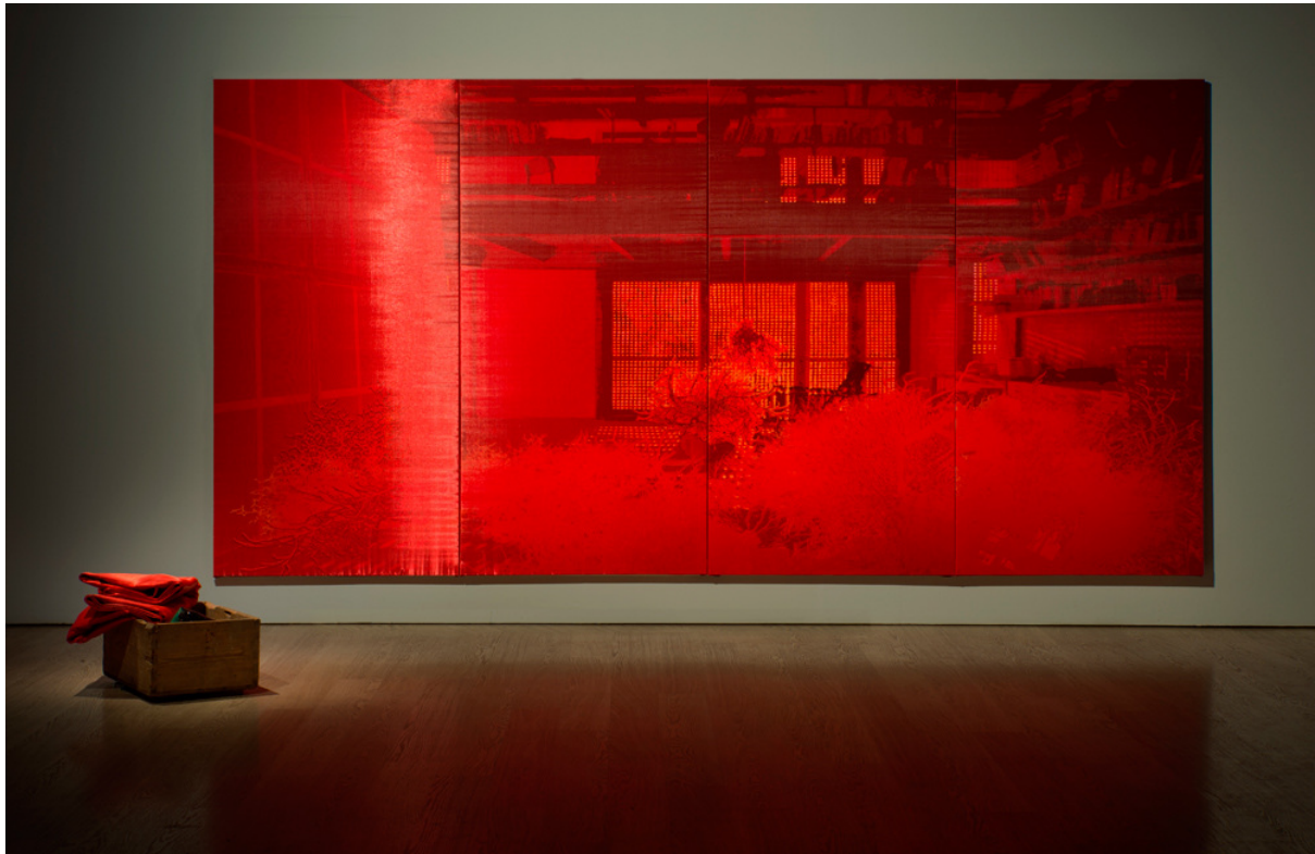
Figura 4. Javier Garcerá, "Ni decir". 200 x 400 cm., técnica mixta sobre seda, 2018