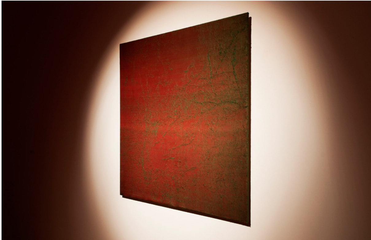
Figura 6. Javier Garcerá, “La menor distancia”. 110 x 110 cm., seda erosionada, 2017

Para que ese tipo de experiencia que acabamos de señalar se produzca, es necesaria una mirada contemplativa que no es más que el ejercicio de dejar que las cosas se acerquen y muevan hacia nosotros. Si anteriormente hemos señalado que la imagen mediática digital carece de toda distancia, en este caso las piezas que componen el proyecto expositivo “Ni decir” ofrecen esa distancia necesaria para la experiencia del ver . Una distancia que nos permite reconocer lo que vemos al tiempo que nos asegura que jamás tendremos acceso a un conocimiento absoluto de lo que acontece entre la obra y el sujeto. Porque la obra es un umbral interminable, un umbral absoluto ante el cual uno debe suspender todo su ser y aceptarse en una entrega que se desvanece en cada instante para volver a reaparecer si nuestra actitud sigue siendo de escucha.