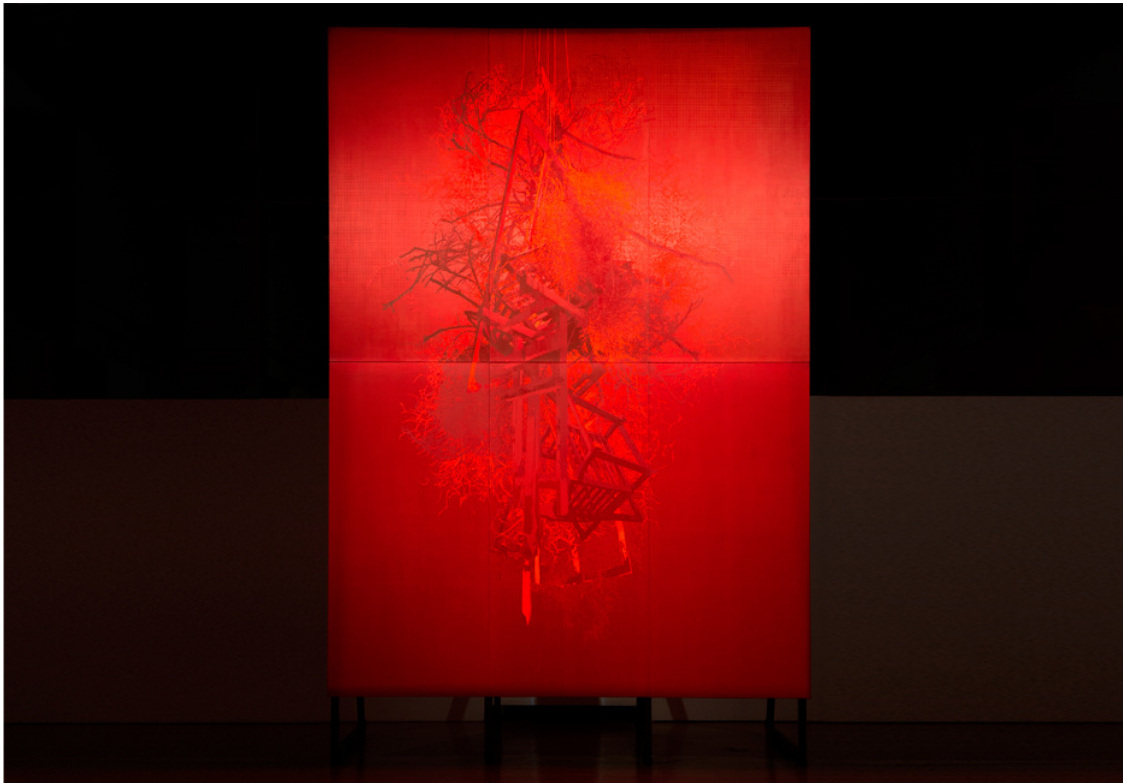
Figura 2. Javier Garcerá, "Que no cabe en la cabeza". 500 x 360 cm., técnica mixta sobre seda, 2017