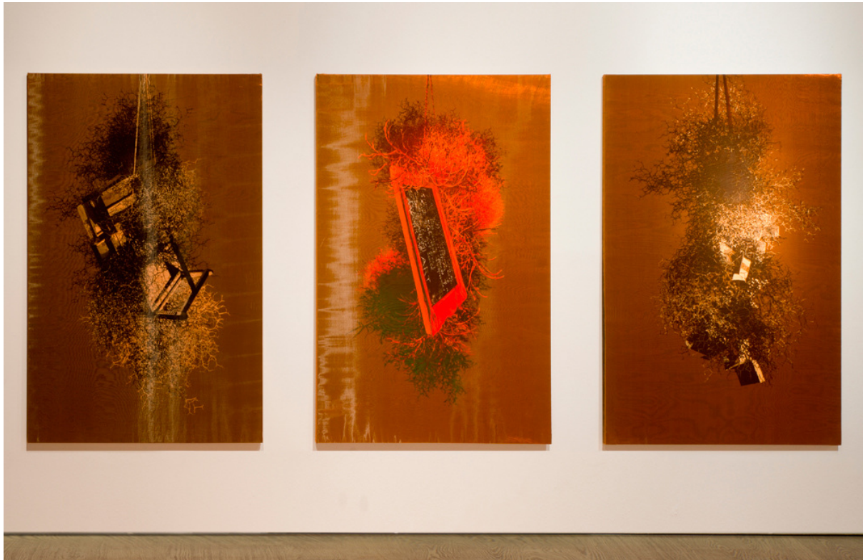
Figura 3. Javier Garcerá, "Hogueras". 200 x 130 cm., técnica mixta sobre seda, 2017/18