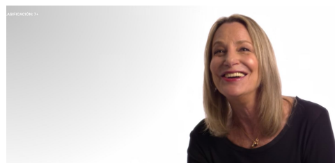
2. "Abstract" cap 7

La estética que manejan hace que te sientas interesado por el tema y a la vez que estás percibiendo imágenes que aportan valor al discurso.