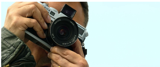
1. "Abstract" cap 6

Desde el primer momento en el que me planteé el formato y la temática del trabajo, recurrí al documental Abstract (2017). En concreto los capítulos 6 y 7 en los que se habla de profesiones como el diseño y la fotografía. Se trata de un documental que me inspira en dos de sus aspectos. En primer lugar, la estética. Sólo con el trailer o la cabecera ya se convierte en una pieza audiovisual interesante. El juego del montaje y el cuidado de los planos hace que el espectador reciba no solo calidad, sino una mirada al objeto de estudio lo más profesional posible.