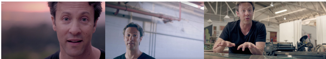
3, 4 y 5. “ The creative brain ”, (narrador intradieético)

documental, evidencian que hay una investigación detrás de las cámaras, que se mueve en búsqueda de respuestas y nuevos datos.