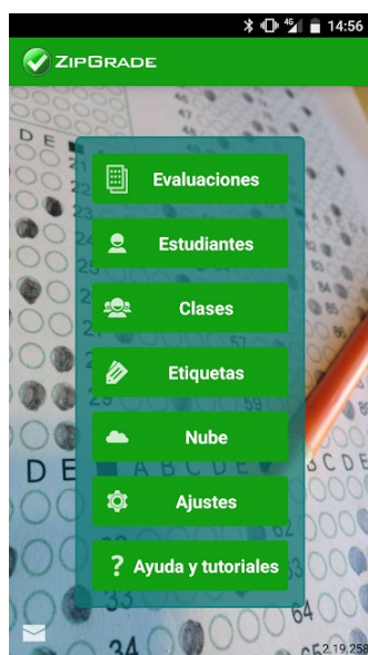
Fig. 1 Menú principal