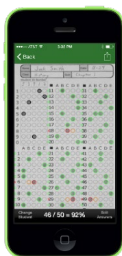
Fig. 3 Plantilla de respuestas corregida

Desde la web de Zipgrade puedes crear tus clases (grupos), bien introduciendo los datos de cada estudiante, o bien importando un listado de los alumnos como archivo cvs. A cada alumno le asigna directamente un número de identificación personal. Tanto las fotografías de las pruebas corregidas, como los resultados de cada prueba, sus gráficos y demás datos