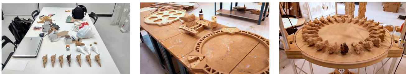
Figura 4. Proceso de fabricación y montaje de la estructura del zoótrolo, y posterior disposición de las impresiones 3D en el plato central para comenzar con las pruebas de sincronización de las luces con el giro del motor.