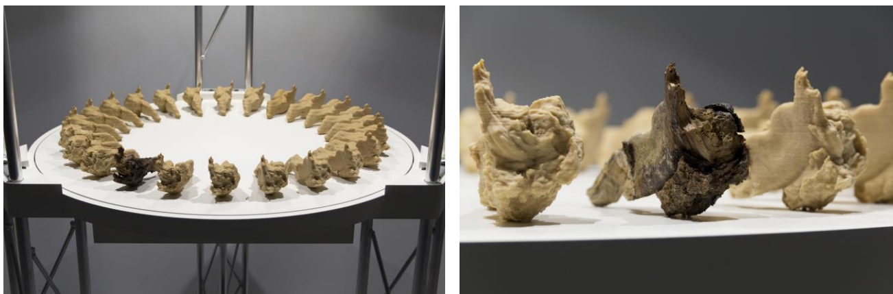
Figura 7. Zoótrofo 3D –Chopo cabecero, 2019. Vista de detalle.