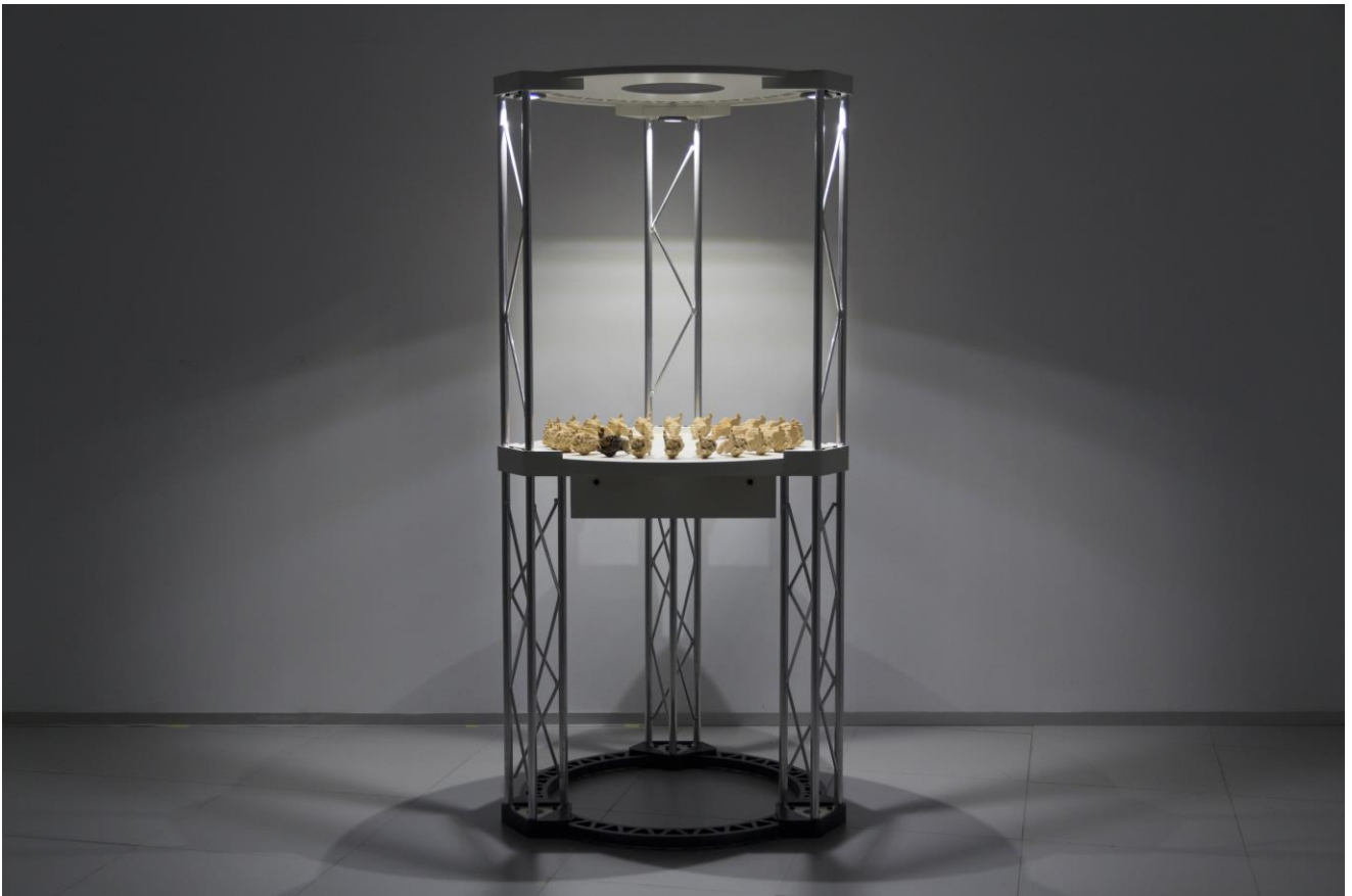
Figura 6. Zoótropo 3D –Chopo cabecero, 2019. Vista de instalación.

Sin embargo, también hay algo paradójico, ya que al substituir el proceso de manipulación humana con métodos artesanales por otro en el que se emplean las nuevas tecnologías, al cambiar el ciclo de poda y rebrote por uno de iteración digital, en la seriación también parece emerger lo maquínico en tanto siniestro –un poco a la manera de Metrópolis . Así, al observar la pieza, se da un tipo de extrañamiento –noción acuñada por Victor Sklovsky (2012) en 1917, vinculada al formalismo ruso y originariamente común a todo arte– que cobra aquí una fuerza renovada, fruto de la combinación de dos posibles diferentes dimensiones de esta experiencia. Se aúna pues un tipo de extrañeza vinculada a lo óptico, esa sorpresa de lo visualmente impactante y nuevo, con ese otro tipo de desasosiego que de algún modo pone en crisis al sujeto, presente en el pensamiento de otros autores con fórmulas como inquietar el ver (Huberman, 1997), vinculadas a su vez al pensamiento lacaniano –como en el planteamiento de Foster (2001).