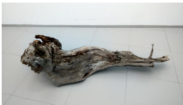
Figura 2. a) cuenca alta del río Huerva donde se pudo observar un ejemplar maduro de chopo cabecero. b) fragmento del tronco de un chopo cabecero caído, del que extraerá el fragmento final para realizar la serie de impresiones 3D.

El interés para el proyecto radicaría por lo tanto en que ese pequeño fragmento de leña retorcida elegido para la pieza, esa aparentemente caprichosa forma, vinculaba la reflexión abstracta a un hábitat concreto, a unas prácticas y unos modos de vida configuradores del entorno, conduciendo la reflexión hacia una nueva capa semántica en la que se aborda la relación entre naturaleza y cultura, así como entre producción industrial y trabajo artesanal, desde un enfoque que pone en cuestión posicionamientos dicotómicos, entendiendo el paisaje como algo en lo que confluye lo natural y lo humano, y que contribuye desde la visualidad a la configuración de una determinada identidad.