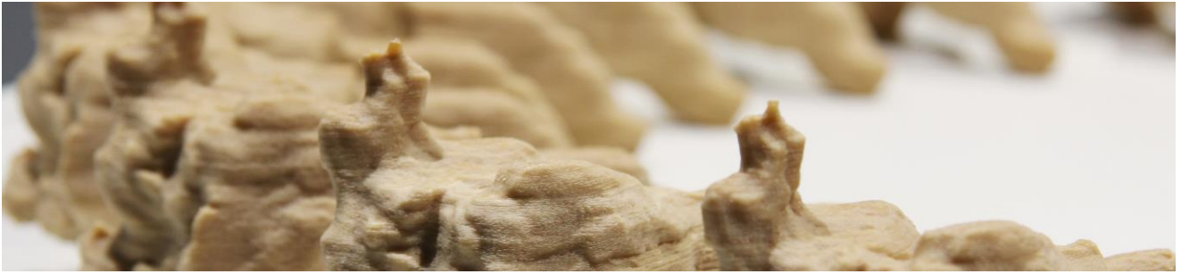
Figura 5. Zoótropo 3D –Chopo cabecero, 2019. Vista de detalle.