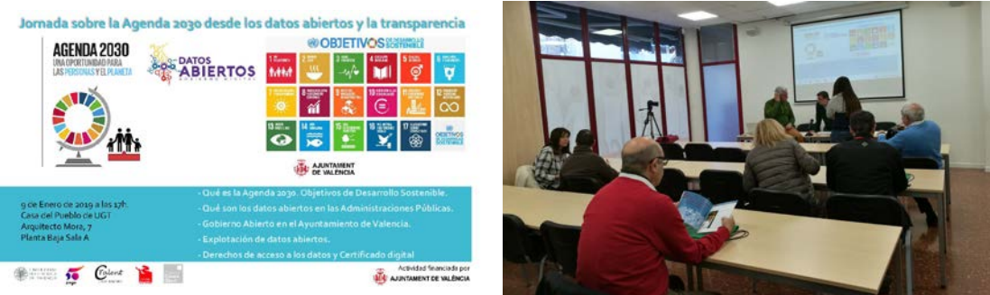
Fig. 2 Proyecto La Agenda 2030 desde los datos abiertos y la transparencia. Difusión de la experiencia en Casa del Pueblo de UGT. (2a) Cartel de difusión, (2b) Preparando difusión del proyecto