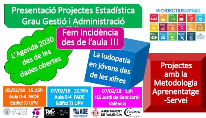
Fig. 4 Cartel de la difusió de los proyectos la Ludopatia en cifras y La Agenda 2030 desde los datos abiertos y la transparencia

Uno de los mejores resultados que se obtiene al utilizar el ApS como metodología de aprendizaje-enseñanza es justo el servicio que implica la metodología y como produce un cambio de 360° en como se produce el aprendizaje. El alumnado además de aprender y pensar en superar las asignaturas, deja de pensar en si mismo para pensar en quien recibirá el servicio, cual será la mejora que producirá en la sociedad, el reto al que podrán dar