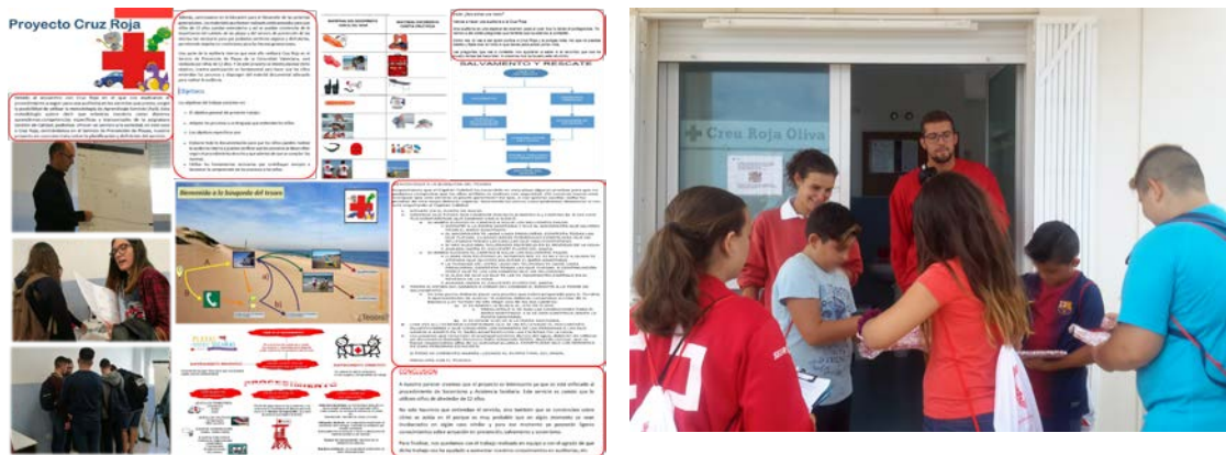
Fig. 3 Proyecto Niñas y niños auditores ISO 9001 en Cruz Roja. (3a) Extractos de los materiales para la auditoria del proyecto y formación específica sobre auditorías internas en locales de CR Valencia. (3b) Momento de la auditoría interna en la Playa de Oliva.