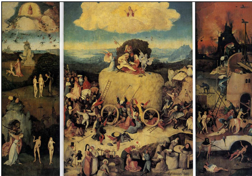
Figura 2: Pintura “Las construcciones infernales” del tríptico del carro del heno del Bosco (Museo del Prado, Madrid).

El origen de la grúa puede verse reflejado en la pintura que a continuación se muestra. La escena en sí es la central de la parte derecha del tríptico, El Bosco ya plasmó unos sistemas de elevación imprescindibles en la construcción de una torre por parte de los diablos.