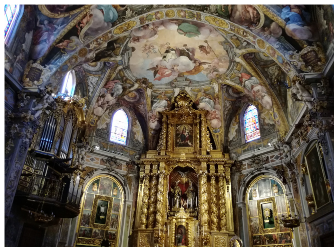
Interior de la Iglesia de San Pedro Mártir y San Nicolás Obispo

Nos podemos plantear si ello supone una operación de marketing aprovechando el impacto social que produjo la restauración en los ciudadanos. Consideramos que en los primeros momentos los espacios se podían visitar de forma libre y transcurrido un tiempo se implantó el cobro de una entrada para la visita, con un régimen diferente al establecido en otros espacios, como, por ejemplo, museos. Junto a ello, otro problema que se plantea es la “utilización” del espacio. En este caso, estamos hablando de espacios de culto, por lo que las actividades paralelas que se realizan están relacionadas con el carácter sacro del mismo (conciertos), pero se plantearía si es posible realizar otro tipo de actividades. Desde luego, podemos indicar el debate surgido con la utiliza-