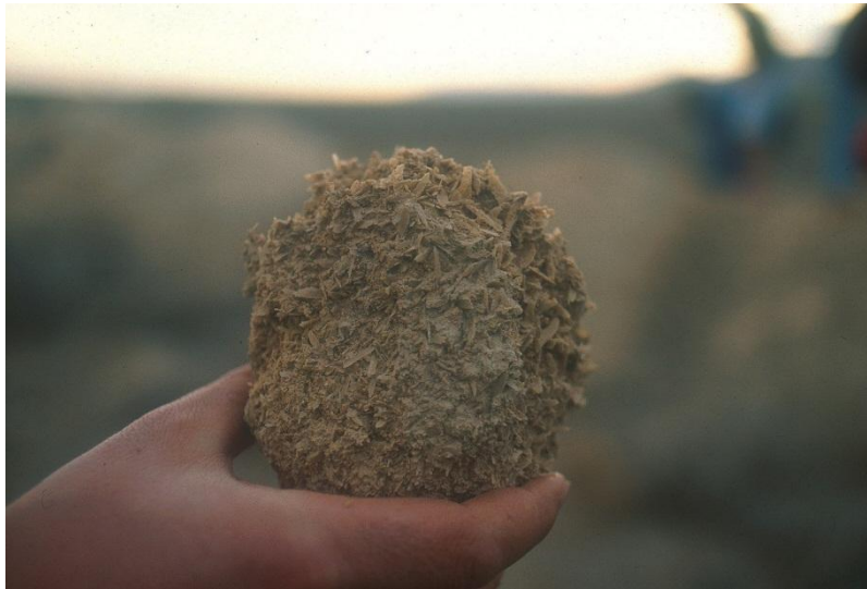
Imagen 5: Acumulación de yeso cristalizado (vermiforme) en un horizonte gypsic (Ciudad Real)

La acumulación de yeso es típica de regiones climáticas áridas. En los suelos con altas concentraciones en sales es frecuente que se produzcan acumulaciones de yeso por precipitación como resultados de la concentración de la solución de suelo por efecto de la evaporación y succión del agua por parte de las raíces de las plantas.