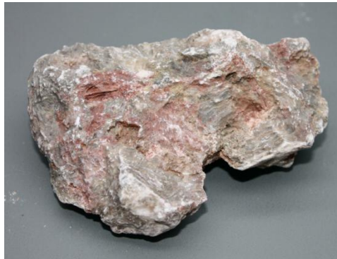
Imagen 2: Yeso rojizo y Imagen 3: Yeso grisáceo-rojizo