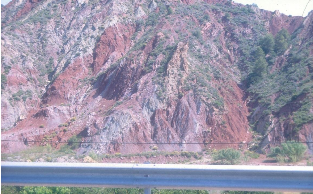
Imagen 4: Degradación por procesos de erosión hídrica en margas yesíferas del Triásico (Keuper) (Agost, Alicante)

Por otra parte en el proceso de hidratación de la anhidrita también da lugar a la formación de yesos que es un material muy frágil y produce altas tasas de erosión del suelo (imagen 4)