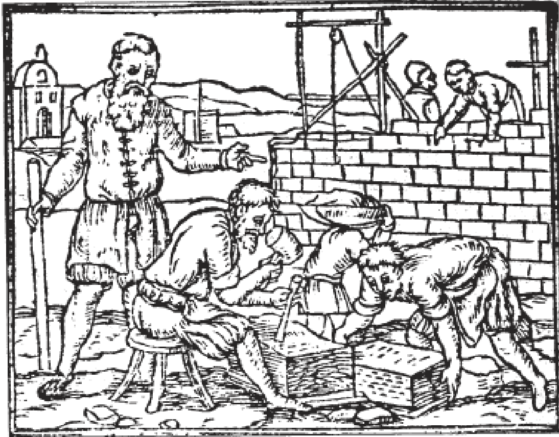
Figura 3 Constructores en la Edad Media

¿Quiénes construyeron las espléndidas catedrales medievales, que hoy llaman la atención? Éstas fueron levantadas por un grupo de personas anónimas que trabajaron tiránicamente en la extracción, tallado y colocación de las piedras que forman parte de esos edificios que se elevan al cielo, marcando un hito en nuestras ciudades medievales.