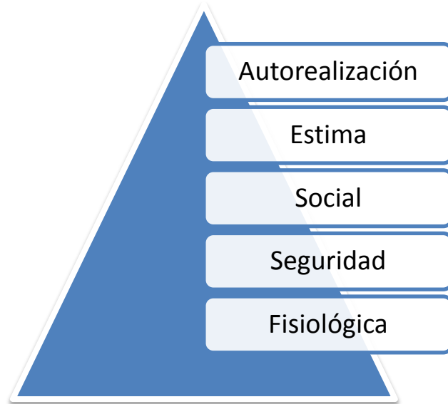
Figura 2 - Jerarquía de las necesidades de Maslow Fuente: Robbins (1998)

Teoría Y: La suposición de que a los empleados les gusta trabajar, son creativos, buscan la responsabilidad y pueden ejercer la auto dirección.