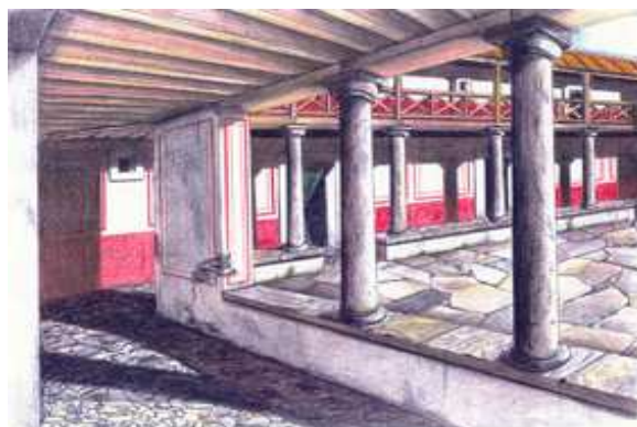
Fig. 3. Ilustración del dibujante D. Paco Boluda del corredor del patio de la domus.

Para la ilustración de la hipótesis virtual se realizaron los alzados de las plantas en 2D, que corrieron a cargo del ilustrador Paco Boluda, y los esquemas de las secciones transversales y longitudinales de las perspectivas en 3D.