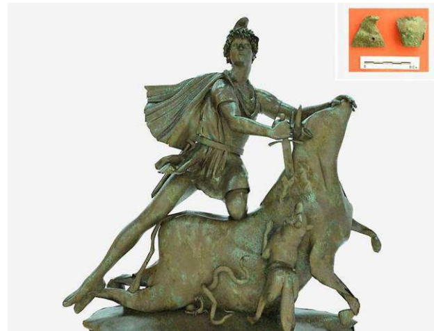
Fig. 9. Reconstrucción virtual de carácter idealizado que representa los elementos comunes de una “tauroctonía”.

En la última fase de virtualización de este modelo escultórico se tomó como base los restos de los fragmentos encontrados para reproducir, en el texturizado de la pieza, la pigmentación del material original. A este material se añadieron niveles de patina, con la finalidad de conseguir un efecto de envejecimiento de la pieza que la dote de un mayor realismo.