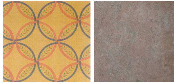
Fig. 5. Ejemplos de texturas de dibujo con intervención y textura de naturaleza fotográfica con intervención empleadas en la reconstrucción.

Partiendo de que las imágenes en sí mismas son elementos dinamizadores del discurso audiovisual, se realizaron fotografías en los puntos señalados del recorrido del yacimiento, a fin de utilizar el recurso de contraste fotográfico por alternancia : yacimiento-reconstrucción virtual.