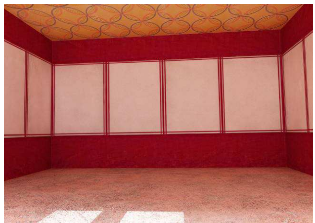
Fig. 6. Reconstrucción virtual que representaría una de las estancias decoradas