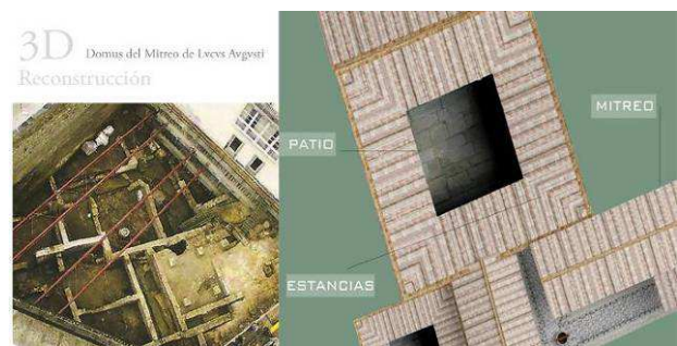
Fig. 1. Hallazgo de una gran Domus y un mitrabeum. Infografía 3D sobre la Domus en época Bajo Imperial.