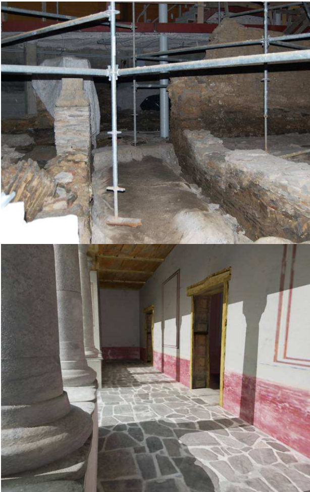
Fig. 8. Reconstrucción infográfica basada en contraste visual por alternancia correspondiente al corredor del patio.

fase de edición y montaje, la unión entre los distintos puntos se realiza empleando efectos de transición por fundidos de imágenes y videos, que dan continuidad al trayecto del recorrido. Este recorrido finalmente se sitúa sobre un plano general del yacimiento en composición digital, para que el espectador pueda hacerse una mejor estructuración del espacio y obtenga una mayor percepción global en el proceso de esquematización virtual del yacimiento.