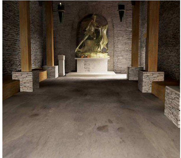
Fig. 10. Hipótesis reconstructiva del interior del mitreo.

A diferencia de otras estancias de la domus, este espacio no presenta restos de pintura ni enlucido en sus paredes (cabe señalar el alto grado de alteración que presentaba este sector de la excavación debido a la incidencia de otras estructuras de época contemporánea), de manera que en el interior se presenta con un texturizado únicamente de pizarra. El conjunto se completa con dos bancos corridos de madera por los laterales entre las pilastras, a modo de triclinios, y que servirían para celebrar la comida colectiva que era un acto central en el rito, representando así un acontecimiento central del mito, como es la celebración del banquete entre Mitra y Helios tras la muerte del toro.