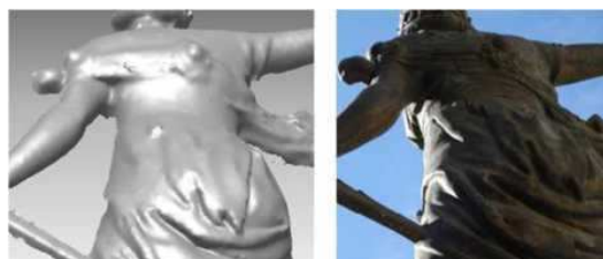
Figura 15. Vista de espalda

Como consecuencia de las limitaciones de resolución y del proceso de modelado, ciertos de talles aparecen difuminados (véase el broche de la pierna en Figura 15).