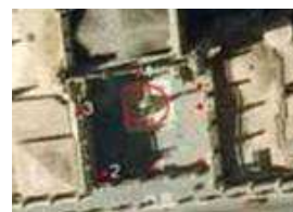
Figura 5. Localización del escáner en los barridos realizados

Generación de nubes de puntos: se realizaron siete barridos de la escultura, cuya distribución aparece reflejada en la Figura 5.