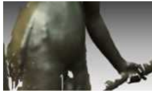
Figura 11. Superficies después del suavizado

Una vez comprobados los correctos acabados de cada superficie realizamos el ensamblaje de todas para obtener el modelo completo. Empezamos uniendo dos superficies con suficiente área de contacto.