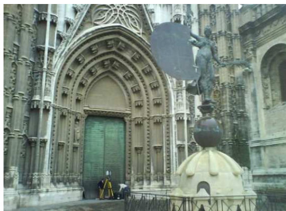
Figura 4. La copia del Giraldillo objeto del presente trabajo