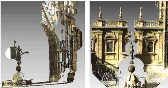
Figuras 6 y 7. Nubes de puntos completas desde uno y otro punto de vista

consume menos recursos informáticos y también es más fácil de manejar. Figura 8.