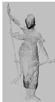
Figura 1. Nube de puntos obtenida en 2000