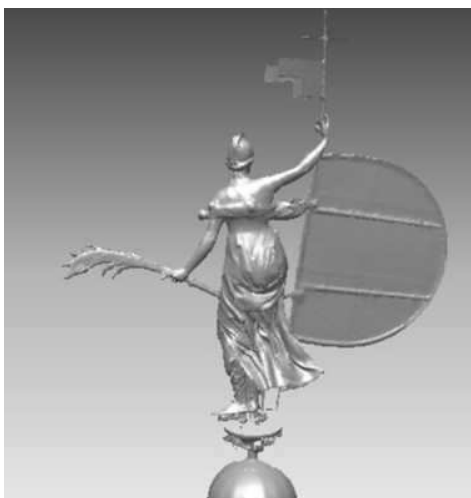
Figura 14. Maqueta virtual resultante. Vista posterior