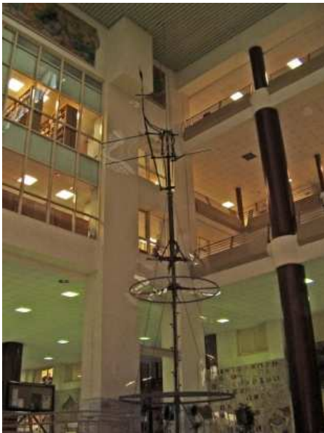
Figura 2. Vástago y mecanismo giratorio. (1.770)

Dos breves datos pondrán de manifiesto la colosalidad de la misma, en efecto sus pies miden algo menos de medio metro y su altura es de tres metros y medio. La Figura 2 presenta el vástago y el mecanismo giratorio de la veleta, datado en 1.770 y situado en uno de los patios interiores de la Escuela Técnica Superior de Ingenieros de Sevilla.