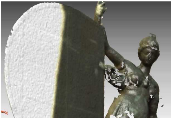
Figura 8. Resultado de la triangulación

Al tratarse de superficies sin espesor, se puede indicar al programa de modelado qué parte de la superficie generada debe ser visible, para poder diferenciar con facilidad cuál es la parte exterior o haz (la que debe mostrarse visible) y la interior o envés (que permanecerá invisible en todo momento).