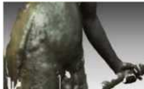
Figura 10. Superficies antes del suavizado