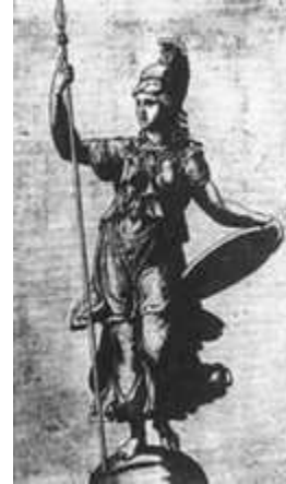
Figura 3. Palas Atenea: Marco Antonio Raimondi

Atenea de Giulio Romano o de Perin del Vaga según otros autores. Esta representación dio lugar al grabado de Marco Antonio Raimondi, en el que pudo inspirarse Luis de Vargas.