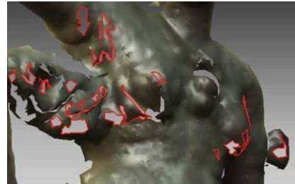
Figura 9. Agujeros en la triangulación

representan un aspecto demasiado rugoso, que no corresponde a la realidad del objeto escaneado. Esto hace necesario realizar un suavizado de la superficie, pero teniendo en cuenta que los puntos de base deben conservar su posición original, con objeto de mantener una representación fiel del original. tal como muestra las Figuras 10 y 11.