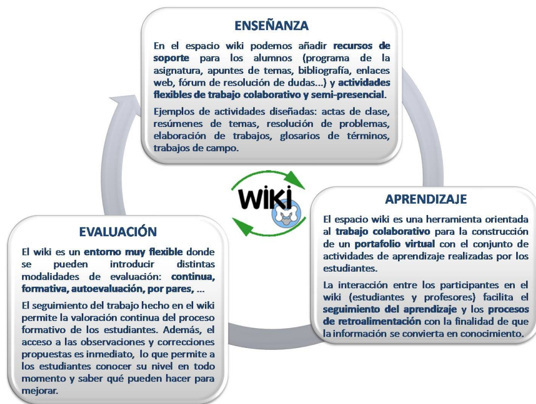
Figura 3 - Proceso de enseñanza-aprendizaje