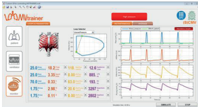
Figura 2: Pantalla del laboratorio virtual para la simulación de pacientes con ventilación mecánica (MV-Trainer) que permite predecir la respuesta del paciente ante diferentes modos de ventilación durante la terapia respiratoria.

permite simular, a través de una interfaz gráfica intuitiva, el efecto de diferentes modos ventilatorios aplicados por un ventilador mecánico a pacientes con diversas patologías y situaciones clínicas, facilitando al médico la toma de decisiones durante la terapia respiratoria.