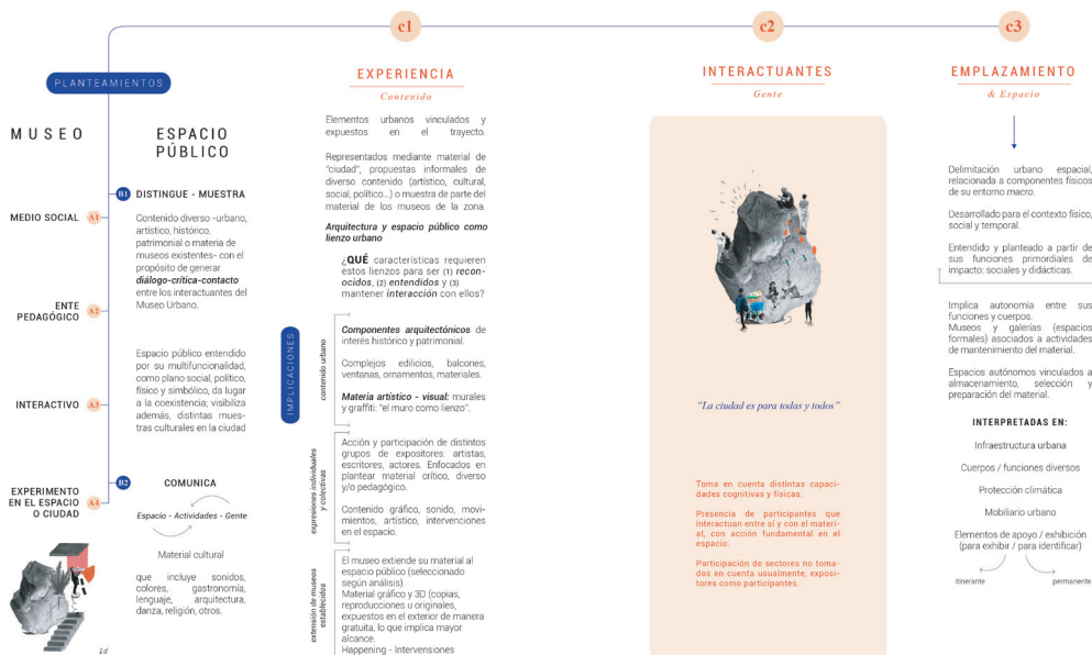
Fig. 2. (Imagen 2) Esquema de lógica: Museo Urbano (Rodríguez, Sofia. 2018)

Según lo anterior, se llevó a cabo la búsqueda de respuestas o acercamientos, mediante el estudio de actividades e interacción en el sitio,