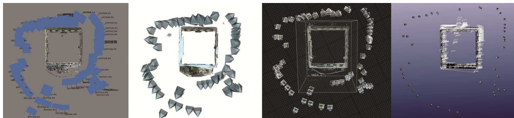
Fig. 2. Stazioni fotografiche in PhotoScan, ReCap Photo, Reality Capture e PhotoModeler.

In quest'ultima – in aggiunta ai valori indicati in giallo ( punti ipotizzati ) – sono stati evidenziati, in rosa e in verde, rispettivamente i valori eccedenti o meno la deviazione standard (Barba, Mage, 2014). Riassumendo, il numero di punti che superano \sigma sono stati: 15 per PhotoScan; 46 per Reality Capture; 16 per ReCap Photo e 102 per PhotoModeler.