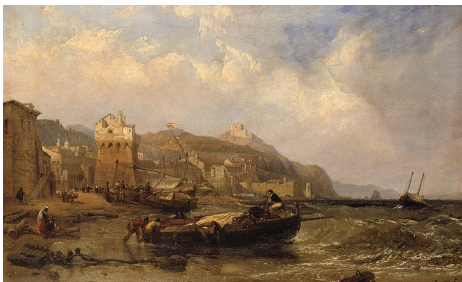
Fig. 1. A View of Vietri in the Gulf of Salerno, (Clarkson Stanfield, 1855); Image ©Ashmolean Museum, University of Oxford.

Il lavoro, infatti, prevede un'originale analisi e confronto delle metodologie impiegate per l'acquisizione e l'elaborazione dei dati. Questa valutazione, che ha come base uno sviluppo della teoria degli errori, si propone di stimare l'affidabilità e la precisione degli elaborati generati. Il metodo per il raffronto, inoltre, troverà ulteriore riscontro sulla base del valore predittivo di un test condotto secondo il paradigma della close-range photogrammetry e l'implementazione di tecnologie low-cost applicate alla Torre della Marina, un manufatto storico del XVI secolo sito in Vietri sul Mare.