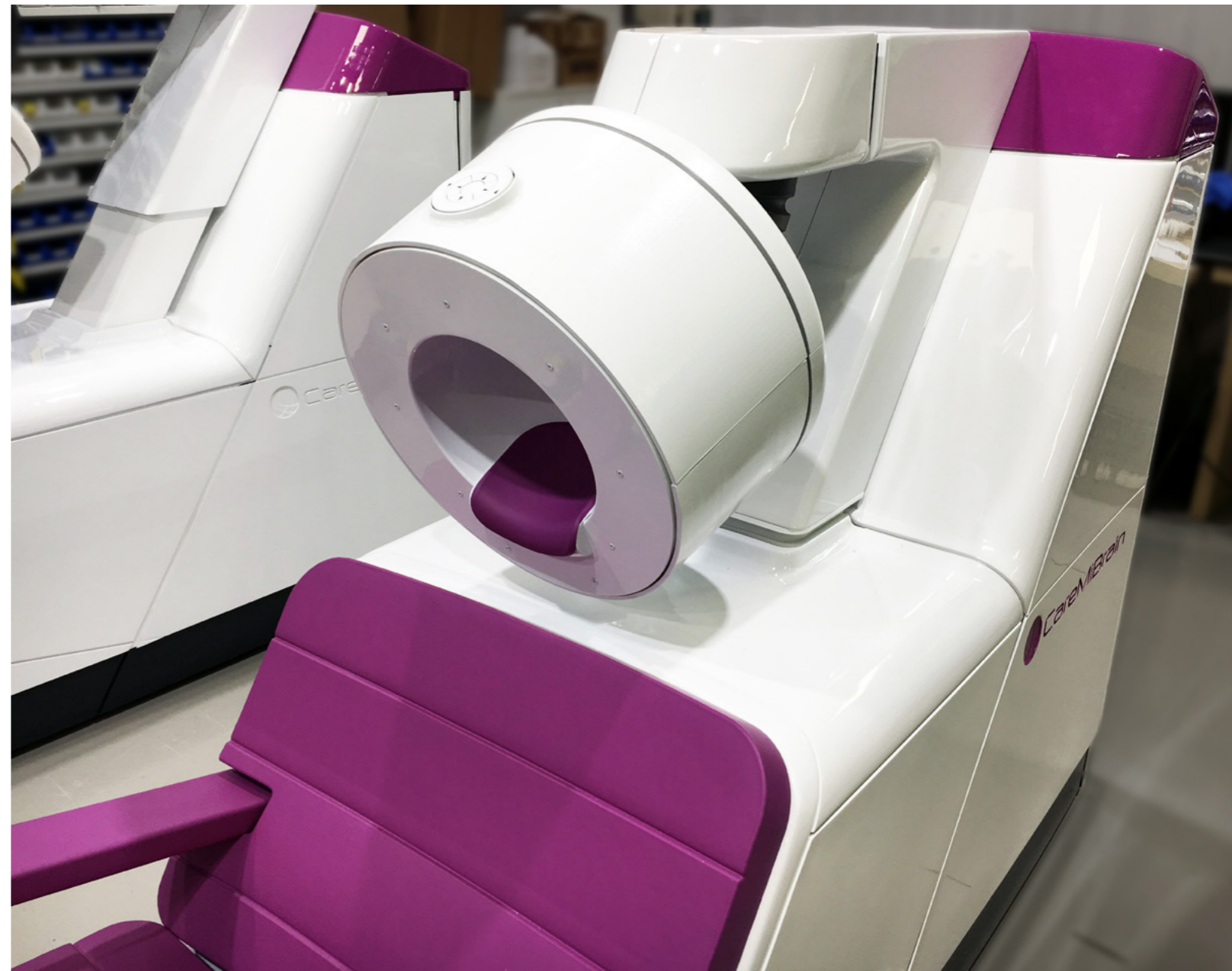
Figura 2 Equipo PET en las instalaciones de ONCOVISION.

El proyecto se completará con el estudio clínico, que se realizará en los centros hospitalarios europeos y norteamericanos referidos anteriormente.