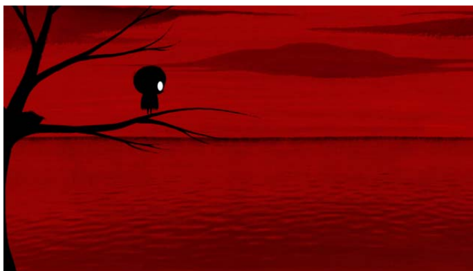
Fotograma del cortometraje.

mostrar el modo de vida de la isla pesquera, mostrando cuán dichosos eran en la familia de la pequeña Dinki, y lo feliz que es con su padre mientras van juntos por el camino que lleva a la escuela y la fábrica. Por esta vía que marcará su destino se encuentran al introvertido pájaro Birdboy, amigo de Dinki, que es incapaz de volar, a quien sólo los pájaros le animan para intentar alzar el vuelo. Todo cambia con el catastrófico accidente que transforma drásticamente el entorno y a sus habitantes: tanto Dinki como Birdboy devendrán adolescentes con problemas de conducta, intentado huir cada uno a su manera de un entorno cada vez más precario.