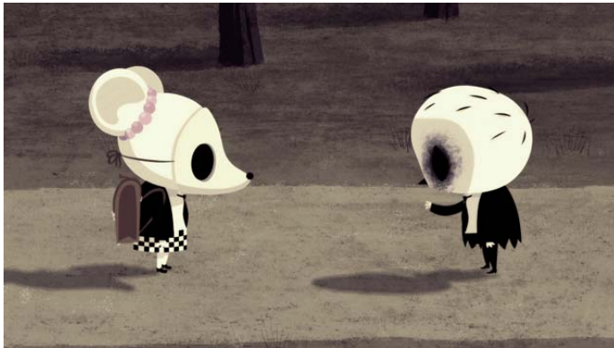
Arriba, el encuentro de Dinki y Birdboy. A la derecha, cartel del corto Birdboy

en el Festival Internacional FOYLE (Derry - Irlanda), Gran Premio de Cine Vasco y el Premio al Mejor Guión Vasco de Zinebi, Premio al mejor cortometraje de animación en el Festival de Cine Nevada City de California, II Premio en el Festival Internacional de Animación de Chicago, y así hasta una treintena de galardones, mencionando también la preselección oficial a los Oscar® al Mejor Corto de Animación para los premios del 2012.