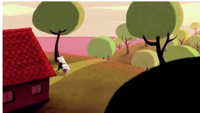
Cartel alternativo de Birdboy (izqda.), e imagen de la vida en la isla antes del accidente.

La adaptación del cómic a la pantalla nunca es fácil, y este caso tampoco lo fue: la estética minimalista del cómic y la forma del trazo de tinta posee una fuerza atrayente, que hace que nos encante su dibujo. Los integrantes del estudio barcelonés, junto a Alberto y Pedro, consiguieron definir unos diseños finales que conectan con los originales a tinta: el resultado ha sido una estética singular, útil para poder animar los personajes, haciendo un uso apropiado de colores neutros que ayudan a mantener ese ambiente desolador y agradable a la vez, jugando también con esta estética para diferenciar entre un antes y después del accidente nuclear.