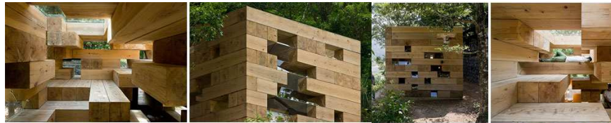
Fig. 11 Final Wooden House 2008 Arq. Sou Fujimoto

Observando la evolución del arte, específicamente de la escultura y de la arquitectura se presentan estos creadores de objetos tridimensionales que toman cualidades de ambas incluso hasta del diseño industrial, creando una gama de objetos tridimensionales no categorizados pero admirados por sus condiciones estéticas, técnicas y constructivas, suscitando varias preguntas ¿si una escultura es penetrable, entonces es arquitectura? ¿Es el recorrido espacial la característica específica que diferencia una obra escultórica de una obra arquitectónica? ¿El aprovechamiento de materiales y tecnologías constructivas son el definidor de la categoría del objeto tridimensional? ¿La poética y estética del objeto clasifica el ámbito creador al que pertenece? ¿Generar sensaciones en el espacio es un acto propio de la Arquitectura, o una escultura también es capaz de producir estas sensaciones?