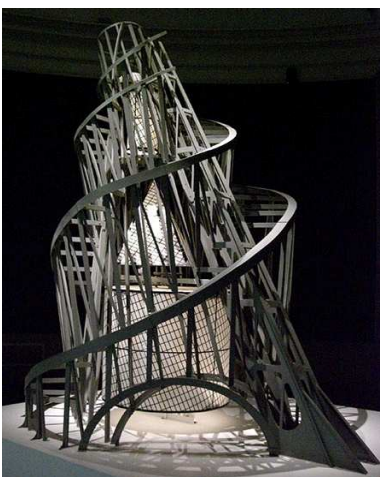
Fig. 4. Maqueta para el monumento a la Tercera Internacional, 1919. Madera, acero y vidrio. 420x300cm

Por otro lado la Escuela de la Bauhaus sienta las bases para una nueva aproximación a las artes plásticas, artes aplicadas y la arquitectura moderna; posteriormente Le Corbusier cree en la arquitectura como cuestión de armonía de pura creación del espíritu, según Argan (1982)