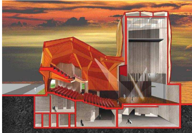
Fig. 3. Render interior. Teatro municipal de Chacao. Caracas.