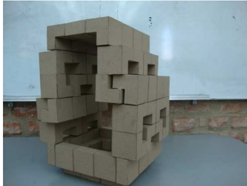
Fig. 12. Ejercicio de diseño 1: habitáculo para un ave