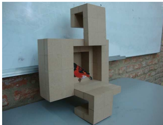
Fig. 15. Ejercicio de diseño 1: habitáculo para un ave