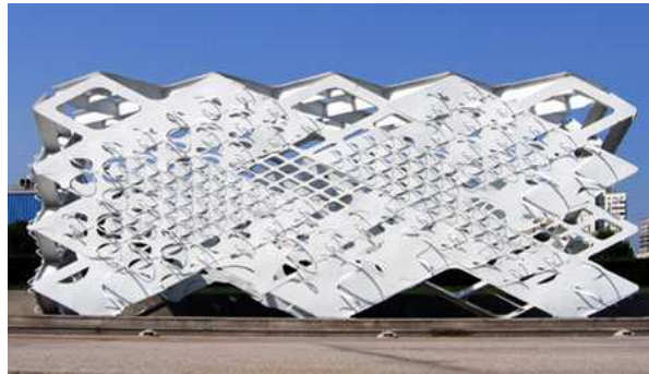
Fig. 9. Pabellón para el Museo Millenium de Beijing. Atelier Manferdini.2006

Por otro lado existen otros creadores que vinculan las características de la escultura con la arquitectura a través de la tecnología, desarrollando propuestas de alto contenido plástico-artístico en las cuales la poesía de la creación artística establece un lenguaje con la tecnología de la contemporaneidad, ejemplo de ellos: