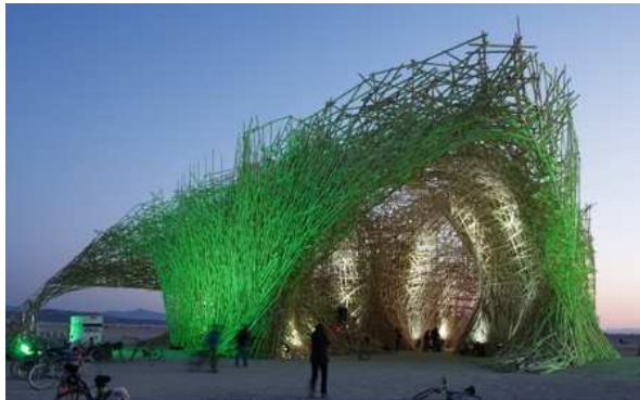
Fig. 11. Giant Arne Quinze .Festival Burning Man . Death Valley, EE UU

Durante toda la línea histórica de la creación humana el hombre a clasificado los quehaceres artísticos según el ámbito en el que se desarrollen, bien sean en lo bidimensional (pintura, dibujo, fotografía) o en lo tridimensional (escultura, instalación, performance), en la contemporaneidad los límites entre estos ámbitos son trasgredidos mezclándose así diferentes quehaceres de la creación, el dibujo se vuelve pintura, la pintura se vuelve fotografía, la fotografía se vuelve performance, el performance se vuelve videoart, el videoart se vuelve instalación, la instalación se vuelve escultura y la escultura se vuelve arquitectura.