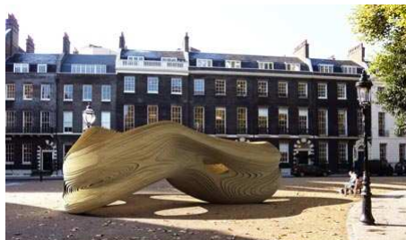
Fig. 7. Architectural Association School of Architecture 2009