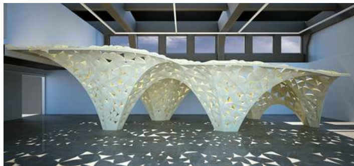
Fig. 10. Voussoir Cloud. Arquitectura IwamotoScott. 2008