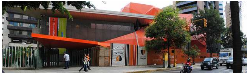
Fig. 1 Teatro municipal de Chacao. Caracas.