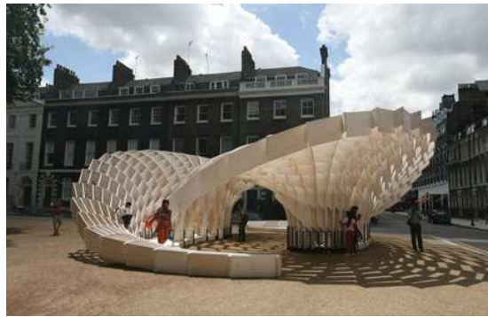
Fig. 8. Architectural Association School of Architecture 2008

Por otro lado existen otros creadores que vinculan las características de la escultura con la arquitectura a través de la tecnología, desarrollando propuestas de alto contenido plástico-artístico en las cuales la poesía de la creación artística establece un lenguaje con la tecnología de la contemporaneidad, ejemplo de ellos: