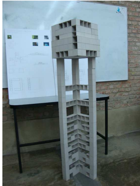
Fig. 14. Ejercicio de diseño 1: habitáculo para un ave