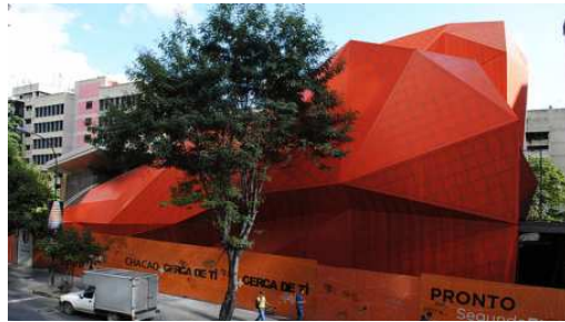
Fig. 2. Teatro municipal de Chacao. Caracas.