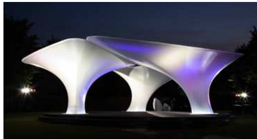
Fig. 6. Serpentine Gallery. 2007 Arq. Zaha Hadid

También existen otros grupos de creadores tridimensionales que desarrollan propuestas a menor escala, capaces de hacer de la arquitectura un hecho más sensorial y estético tamizando los límites de la escultura y la arquitectura, ejemplo de ellos son una serie de Pabellones creados anualmente en la Serpentine Gallery en Londres, para estudiar propuestas arquitectónicas vinculadas al arte contemporáneo a mediana escala, por otro lado la Architectural Association School of Architecture, ubicada también en Londres, desarrolla a baja escala arquitectura escultórica , siendo ejemplos tangibles la fabricación anual de un pabellón de verano desarrollado por estudiantes de la Unidad 2 del primer y segundo año de la carrera, tutorados por Charles Walker y Martin Self, en donde la expresividad del material (la madera) y sus posibilidades constructivas y escultóricas son el fundamento de estas propuestas.