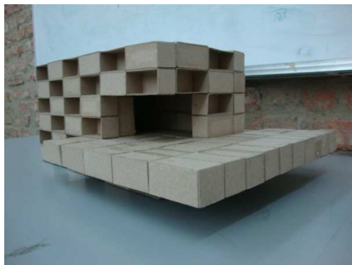
Fig. 13. Ejercicio de diseño 1: habitáculo para un ave